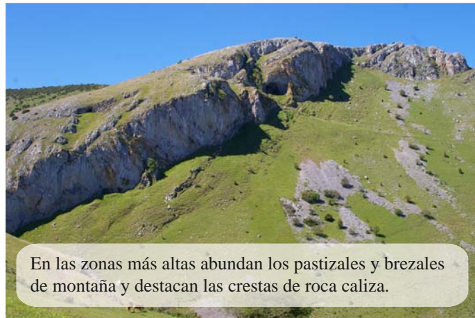
En las zonas más altas abundan los pastizales y brezales de montaña y destacan las crestas de roca caliza.

Brieva de Cameros está al abrigo de la Sierra de Castejón y se articula en torno a los ríos Brieva , Roñas y Najerilla . Asombra su quebrado relieve con bruscos incrementos de altitud. En su territorio encontramos cumbres como el Cabezo del Santo (1.857 m) con imponentes desfiladeros y enclaves propios de alta montaña. En el sector oriental se despliega el Camero Nuevo , al que se accede por el puerto de Peña Hincada (1.412 m) y ofrece excelentes vistas con su máxima cota en San Cristóbal (1.759 m).