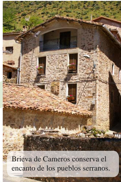
Brieva de Cameros conserva el encanto de los pueblos serranos.

El pueblo conserva una cuidada arquitectura. La piedra es la protagonista tanto en las casas como en el entramado de calles. Destacan las construcciones típicas serranas, casonas solariegas , la antigua fragua , el lavadero o el palacio de los Felguera . En Brieva hay dos iglesias , la de San Miguel y la de Santa María, en Barruso y la ermita de La Soledad.