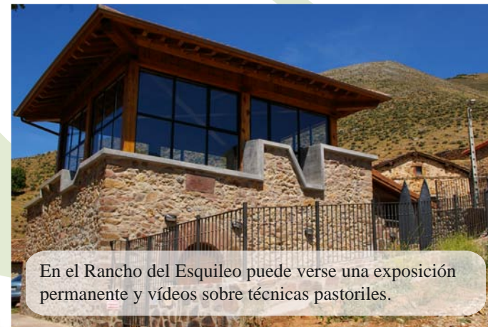
En el Rancho del Esquileo puede verse una exposición permanente y vídeos sobre técnicas pastoriles.

Para los aficionados al senderismo más exigente los alrededores de Brieva ofrecen excursiones muy interesantes como la subida al Cabezo del Santo o el acceso a la misteriosa Cueva Covaruña . Otras rutas más sencillas son las que nos conducen a la localidad de Ortigosa , por Canto Hincado (enlace con el GR-93) y a Ventrosa por el GR-190 "Altos Valles Ibéricos" , por el collado de "El Palo". El " sendero del chozo ", muy recomendable si vamos con niños, recorre el mismo trayecto que hacían los pastores con el ganado para acceder a los pastos del monte y permanecer, con las ovejas, bajo la protección del chozo.