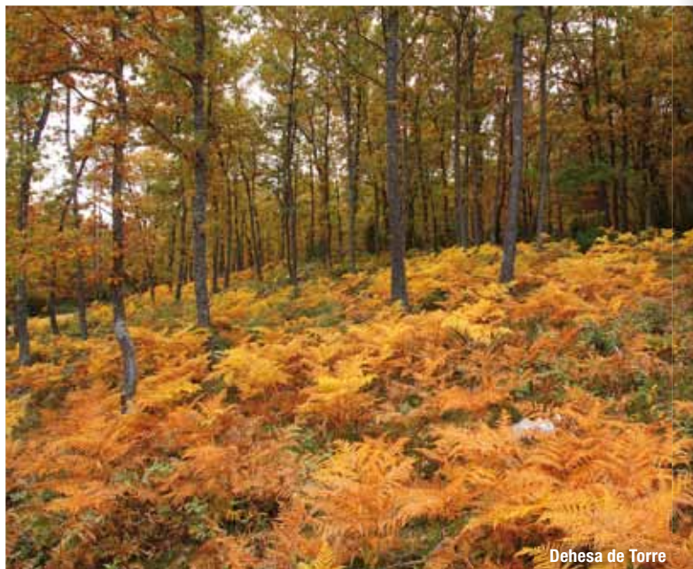
Dehesa de Torre

Laguna de Cameros --15,8 Km.--San Román de Cameros