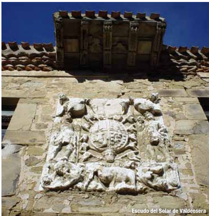
Escudo del Solar de Valdeosera

Los “solares” están constituidos por la propiedad de un territorio, con todos sus derechos y jurisdicciones, asignada a una persona y sus descendientes. En los Cameros pueden citarse tres solares: el de Tejada en Laguna de Cameros, que atraviesa el sendero, el de Valdeosera en San Román de Cameros y el de las Calderas en Pinillos. El solar de Tejada fue concedido por el rey Ramiro I hacia el año 844, y tuvo como primer señor a Don Sancho Fernández de Tejada. Su origen parece deberse al agradecimiento por los servicios prestados a la corona, especialmente por su participación en la batalla de Clavijo contra los moros, y en su escudo de armas se observan 13 banderas junto a una leyenda que dice: “Laudemus viros gloriosos et parentes nostros in generatione sua”. En la actualidad, este solar mantiene la casa solariega con su escudo nobiliario y un monte de unas 400 Ha. con robles y pastos, dedicado a la ganadería extensiva.