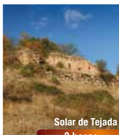
Solar de Tejada

Escudo nobiliario en la casa del Solar y fuente. Salida bordeando la fachada con el escudo para retomar el camino paralelo al río, que al poco deja los robles para entrar en una zona de aulagas. Se accede a una trocha por un talud, y se continúa hacia la derecha hasta dar encima del barranco de las Majadillas. Donde acaba la trocha, girar a la izquierda para coger el antiguo camino que directamente se dirige al citado barranco, en donde hay una portilla.