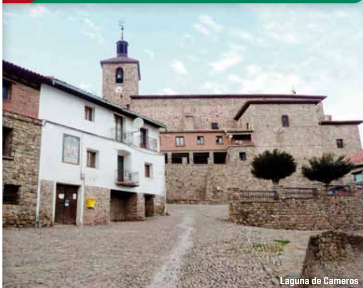
Laguna de Cameros