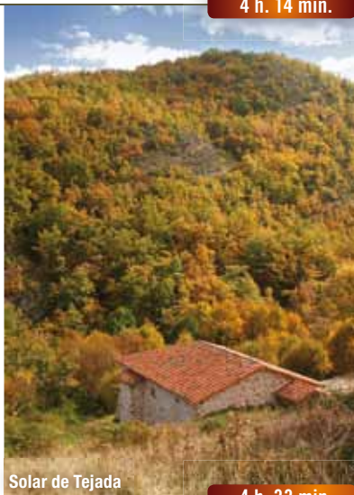
Solar de Tejada

Vadear el cauce y continuar por el camino entre robles. Después de un zigzag, el robledal se empieza a aclarar y finalmente se encaja en un barranco con lastras por donde sube hasta un collado, a cuya izquierda hay una alambrada. Continuar la subida en dirección sur hasta otro collado, observándose hacia la izquierda el pueblo de Cabezón de Cameros.