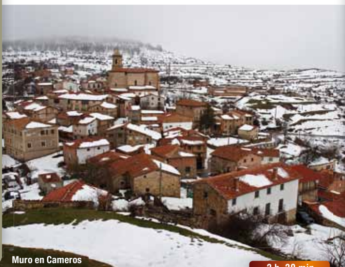
Muro en Cameros