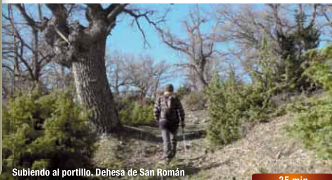
Subiendo al portillo. Dehesa de San Román

Continuar por la pista y, después de dejar un pabellón a la derecha, entrar en la dehesa por una puerta. Cuando la pista se acaba, junto a un abrevadero a la izquierda, continuar la subida de frente por un camino.