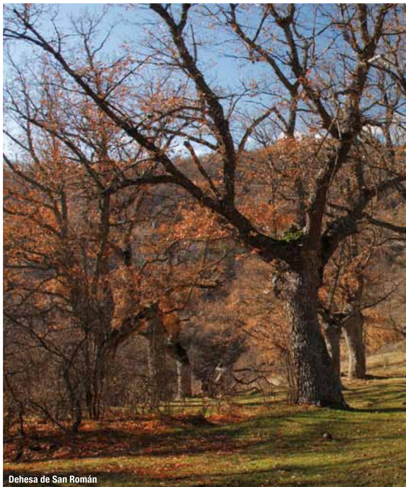
Dehesa de San Román

Sobre un paisaje totalmente deforestado, en donde aún se aprecian huellas de antiguos cultivos abancalados, destacan como únicos vestigios arbolados las dehesas del Camero Viejo. Estas dehesas, algunas de las cuales atraviesa el sendero, como las de Torre, San Román y Torremuña, representan un ejemplo de equilibrio entre la explotación ganadera y forestal de un territorio. Ello ha sido posible gracias a la capacidad de rebrotar, tras la poda, de especies como el rebollo, el quejigo y el haya, mediante la técnica denominada "trasmochó", que permite la extracción de leñas cada cierto tiempo sin necesidad de cortar el árbol. De este modo en el espacio de la dehesa, caracterizada por una baja densidad de árboles, resulta posible la obtención de pastos para el ganado y de leñas para