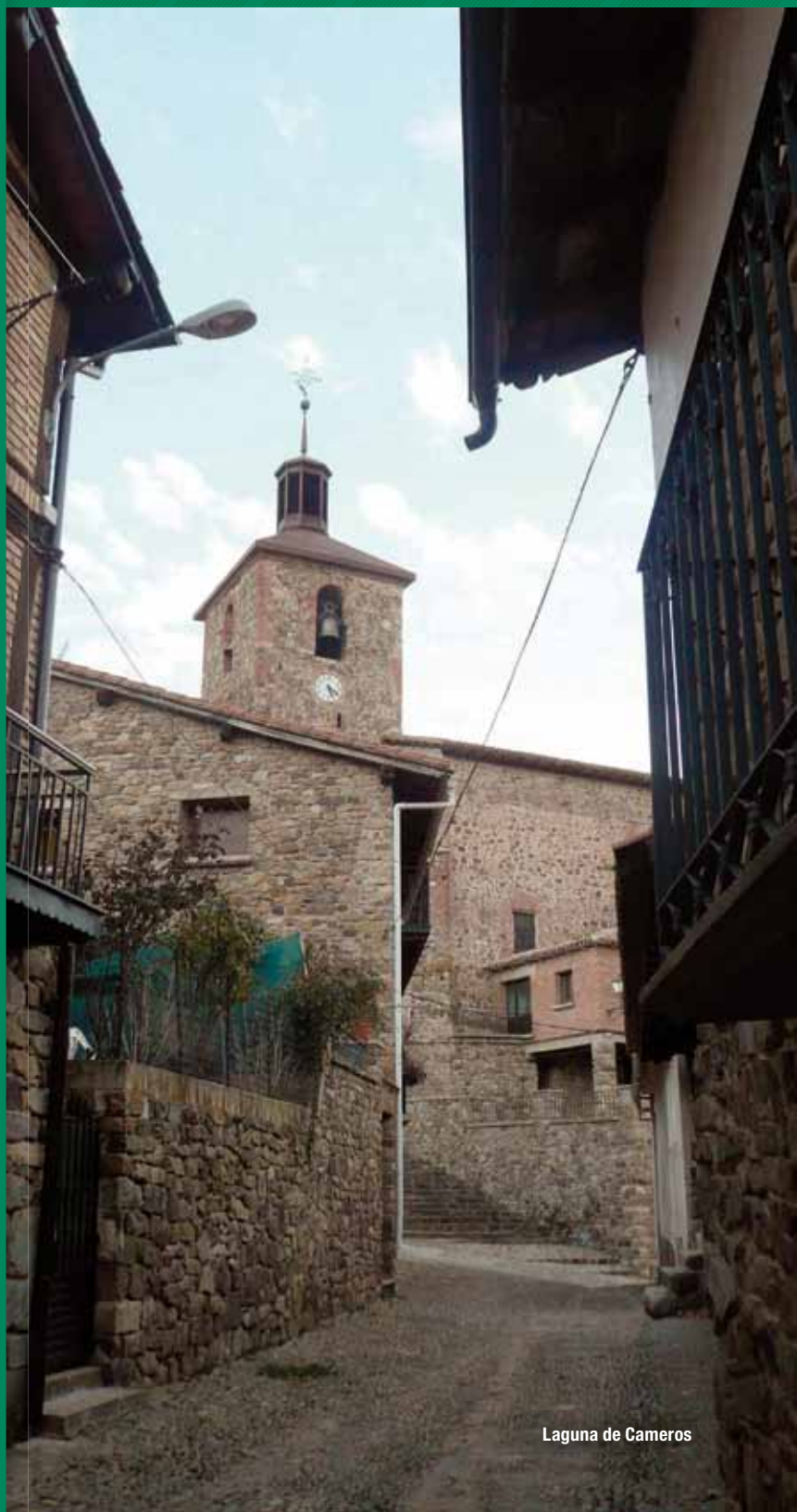
Laguna de Cameros