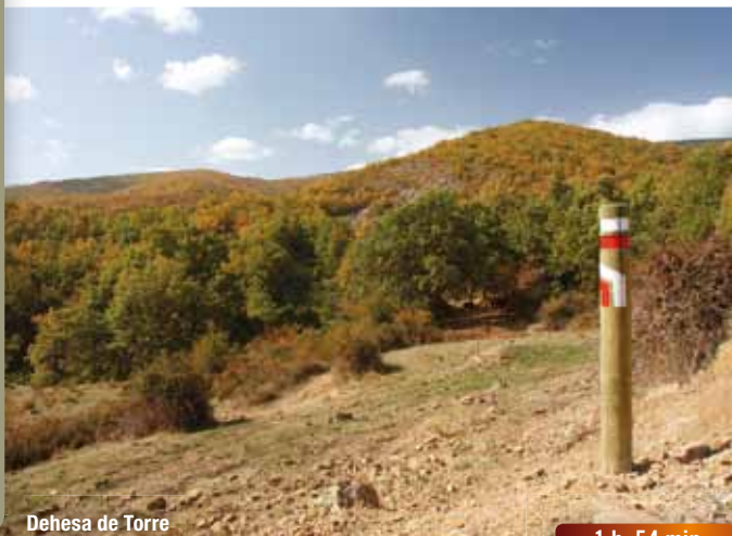
Dehesa de Torre