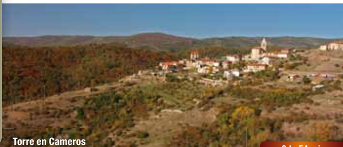
Torre en Cameros