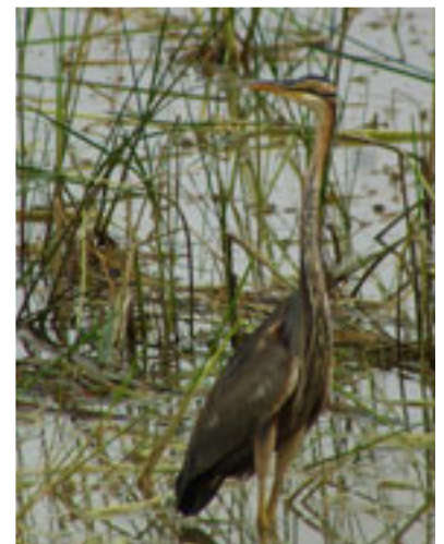
Garza imperial ( Ardea purpurea ).