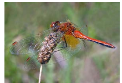
Sympetrum flaveolum . C. Fischer