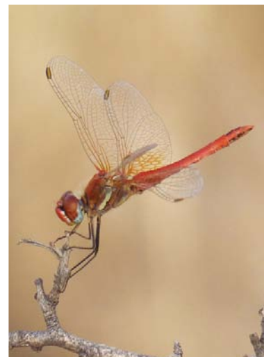
Libélula ( Sympetrum fonscolombii ). M. Marín