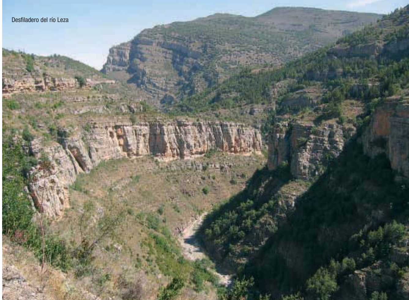
Desfiladero del río Leza

Con la aprobación por parte de la Comisión Europea de la Lista de Lugares correspondiente a la Región Mediterránea en julio de 2006, se ha culminado un camino hacia la creación de la Red Natura 2000 que comenzó a recorrerse hace ya varios años. La Red Natura 2000 en La Rioja está compuesta por seis Lugares que comprenden la tercera parte del territorio regional. De acuerdo a lo establecido en la Ley 4/2003, de Conservación de los Espacios Naturales de La Rioja, tendrán el carácter de “espacios naturales protegidos” y su planificación y gestión se regirá por los correspondientes Planes de Ordenación de los Recursos Naturales, en cuya elaboración ya se está trabajando.