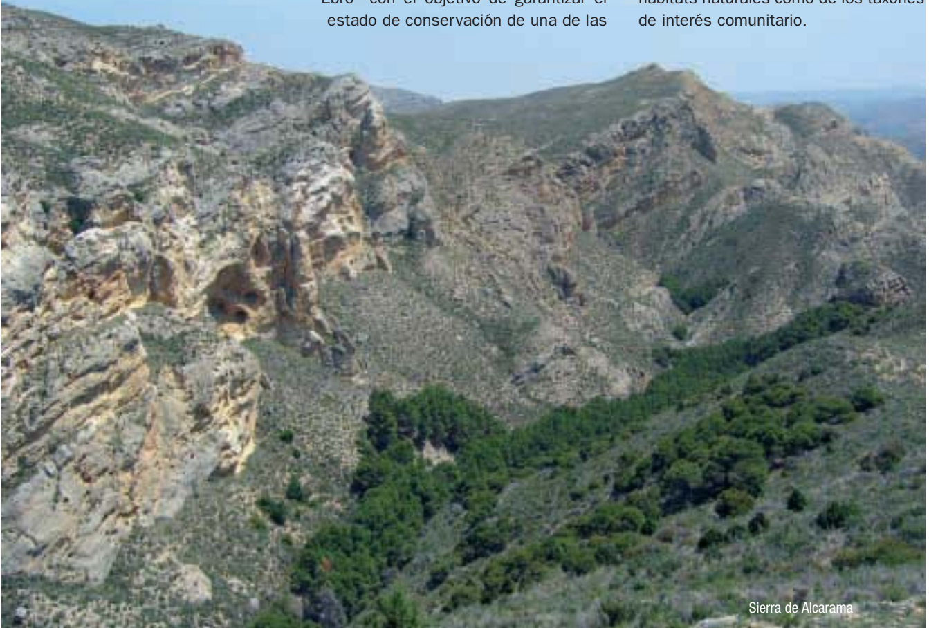
Sierra de Alcarama

El conjunto de lugares incluidos en la Red Natura 2000 permite asegurar el cumplimiento de los objetivos marcados por la Directiva Hábitats, tanto en cuanto a la conservación de los hábitats naturales como de los táxones de interés comunitario.