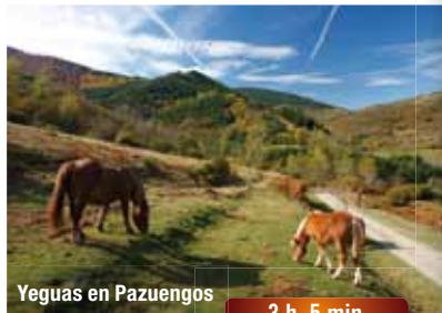
Yeguas en Pazuengos

Salir del pueblo por la calle de la Iglesia, bordeando una fuente, y, en el primer cruce, girar a la derecha por un camino entre muros. En el siguiente cruce torcer a la izquierda para salir a una pista, ya fuera del pueblo, que se toma hacia la izquierda en sentido descendente. La referencia de salida del pueblo es la citada pista que baja hacia el río Espardaña. Antes de comenzar a bajar se observan, hacia la derecha, buenas vistas del Valle del Ebro con los Obarenes y Sierra de Toloño, Sierra Cantabria al fondo, y, de frente en dirección oeste, el collado de Larri-zabala por donde pasa el camino. Se desciende, y al final de la cuesta se abandona la pista por la izquierda para, después de vadear un pequeño arroyo, tomar una pista que se dirige hacia una portilla. Pasada ésta, desecher un ramal por la izquierda y continuar hasta el río Espardaña.