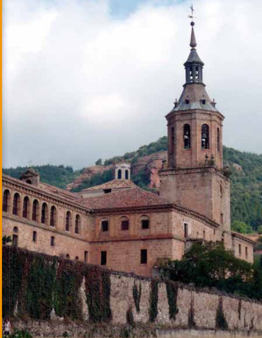
Monasterio de Yuso. San Millán de la Cogolla