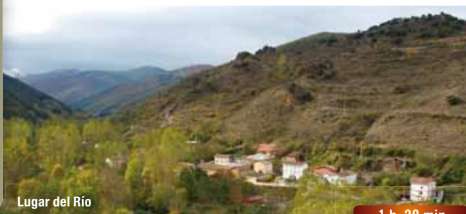
Lugar del Río

Girar a la izquierda y continuar por la carretera hasta llegar a una fuente a la derecha. Un poco más adelante, dejar la carretera y girar a la derecha para subir por una senda y después a la izquierda, dejando un chalet a la derecha, camino de Pazuengos. Tras un pequeño zigzag se tuerce a la derecha y se llega a un zigzag empinado, por donde se accede a un collado. Se ignora el camino de la izquierda y se asciende a media ladera hasta otro zigzag entre rocas y carrascas. Pasado este, el camino tuerce a la izquierda para llanear por antiguas fincas hasta un paso entre rocas que dan acceso a una explanada. Allí se gira a la derecha subiendo por un camino entre fincas hasta un rellano, en donde se tuerce ligeramente a la derecha para subir, con la referencia de unas peñas a la derecha, hasta un pequeño collado.