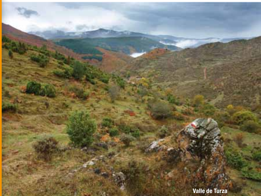
Valle de Turza

El valle del río Oja constituye un espacio natural de carácter único en el territorio riojano, gracias a sus características geográficas y orográficas. En efecto, su particular situación en el extremo occidental de la región, unido a la existencia de una elevada cadena montañosa con más de 2.000 m. de altitud en su cabecera, la Sierra de la Demanda, favorece la existencia de un clima de influencia atlántica, en donde se registran precipitaciones muy elevadas, por encima de los 1.000 m. al año. Ello explica la presencia de un verde paisaje en todo el valle, más cercano al de la Cornisa Cantábrica que al de las tierras del interior de la Península.