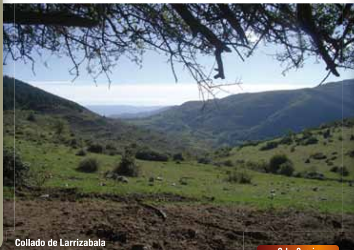
Collado de Larrizabala

Panorámica del valle del río Turza y del Ciloría. Pasada la portilla, girar a la derecha y descender siguiendo la alambrada, con buenas vistas del valle del río Espardaña y Pazuengos al fondo. A unos 500 m. se abandona la alambrada para continuar por el camino viejo hasta llegar a un manantío que inunda el camino. Subir por un talud para continuar el descenso, siempre paralelo al arroyo, entre pastizales. A unos 4 minutos retomar el camino con un pequeño desvío a la derecha. Se atraviesa una pista para continuar por el camino bordeando los muros de los prados hasta el río Espardaña, en el fondo del valle.