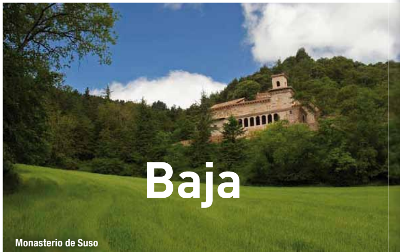
Monasterio de Suso

vestido de sacerdote y una cruz, rodeado de figuras y escenas de los milagros del Santo.