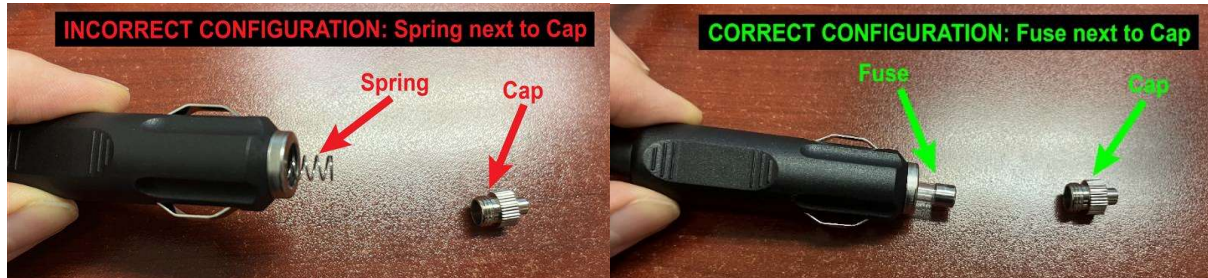
Figura 3: Inspeccione el adaptador del cable de alimentación para cargador de coche, para verificar la posición del resorte o del fusible.

manera permanente para garantizar que no sea necesario realizar inspecciones futuras después de la redistribución y devolución por alquiler.