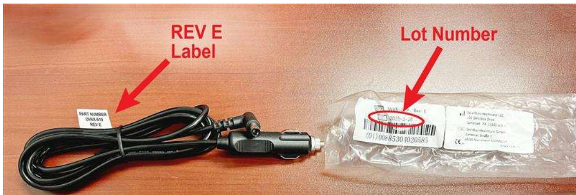
Figura 1: Ubicación de la etiqueta "Rev E" y del número de lote