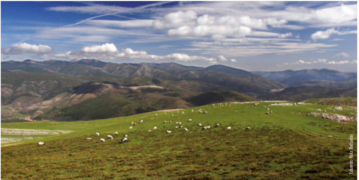
Muchos municipios echan mano del Fondo para acometer proyectos de ordenación silvopastoral y otras actuaciones de mejora de pastizales.

que han puesto en marcha la Consejería de Agricultura, Ganadería y Medio Ambiente y la Mancomunidad de Anguiano, Matute y Tobía para dar a conocer y divulgar los fascinantes paisajes boscosos que esconde esta zona y facilitar que la gente pueda recorrerlos de una forma cómoda y segura.