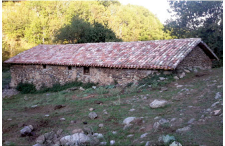
En Pedroso se invirtió parte del dinero del Fondo en arreglar un corral ganadero.

La explicación es muy sencilla: es en La Rioja Baja donde se concentran buena parte de los parques eólicos de la región. Estos aerogeneradores nutren las arcas municipales gracias a la recaudación tributaria representada por la ocupación de los terrenos, el Impuesto de Actividades Económicas (IAE) y el de Bienes Inmuebles de Características Especiales (Bices). Y un 15% de estos ingresos del aire, engrosan, también, el Fondo