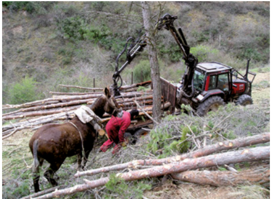
El aumento de las ventas de madera ha provocado un gran incremento del Fondo de Mejoras.

En el año 2015, por ejemplo, se inició con cargo al Fondo de Mejoras del MUP 207 “Carnanzún, El Mediano y El Tozo”, de Cervera del Río Alhama, un estudio de