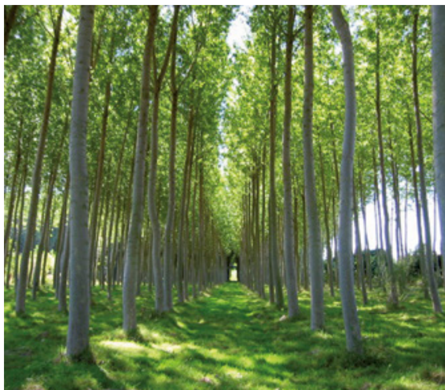
En el caso de las choperas, se ingresa en el fondo un 25% del dinero del aprovechamiento.

Por eso, la mayor parte de los Ayuntamientos ven cómo el dinero de su Fondo crece año a año. En el año 2009, por poner un ejemplo, el Fondo de Mejoras de los Montes riojanos tenía alrededor de 2,7 millones de euros; el pasado 2016 se cerró con un saldo de 4,9 millones, un 80% más. Buena parte de este notable aumento de disponibilidad presupuestaria se debe al gran crecimiento de los ingresos por aprovechamientos, sobre todo por el boom que han tenido las ventas de madera en los últimos años, llegando a cifras récord por encima de los 150.000 m 3 ; y también desde 2015 ha crecido de manera exponencial el dinero que algunos ayuntamientos perciben por los acotados de setas. Así, en esos ocho años los ayuntamientos riojanos han ingresado en sus Fondos de Mejoras 4,52 millones de euros, una media de 566.000 euros al año. En cambio, el dinero invertido ha sido 1,98 millones de euros, una media de unos 247.500 euros al año.