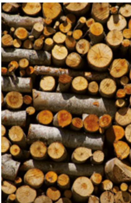
Los montes de Villoslada son los que más ingresan en el Fondo de Mejoras.

Y en esta línea, en el Najerilla, uno de los proyectos más singulares en los que se ha echado mano del Fondo de Mejoras en los últimos años han sido las “Rutas entre hayedos”, una red de senderos señalizados de más de 95 kilómetros