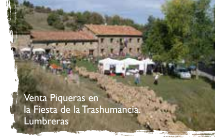
Venta Piqueras en la Fiesta de la Trashumancia. Lumbreras

En la zona se pueden saborear todos los manjares de la buena cocina riojana y en especial de la recia y sencilla cocina camerana, que combina el sabor de antaño con finos toques actuales.