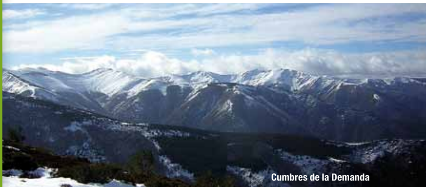
Cumbres de la Demanda

Las partes más elevadas de la Sierra de la Demanda se caracterizan por su clima templado con influencias atlánticas y la ausencia de arbolado por encima de los 1.800 metros. Desde el punto de vista geográfico, el sector forma parte de las cuencas receptoras de los ríos Oja, Cárdenas, Tobía y Valvanera. La altitud máxima oscila alrededor de los 2.000 metros y culmina en el pico San Lorenzo de 2.271 metros. Otras alturas que se encuentran próximas al sendero son los cerros Márulla y Chilizarrías, los picos Cuña y Cabeza Parda, y los Pancrudos.