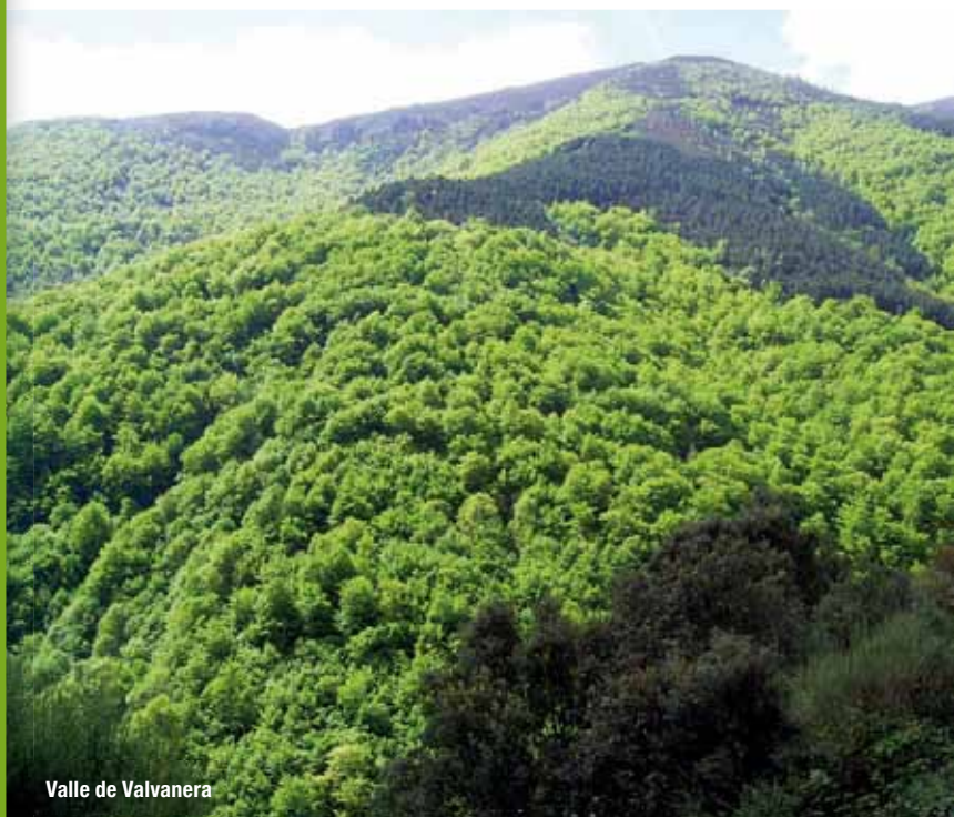
Valle de Valvanera

El Valle de Valvanera aparece como una gran mancha arbolada entre los Pancrudos y los montes Gomare, Nevera, La Velilla, y el Pico de La Rioja. El hayedo domina la umbría junto a bosques mixtos con abundantes fresnos. En la solana se localizan robledales de rebollo y encinares montanos. En la parte alta aparecen algunas repoblaciones de pino silvestre y pino negro, a los que acompañan brezales y pastizales que ocupan las altas cumbres.