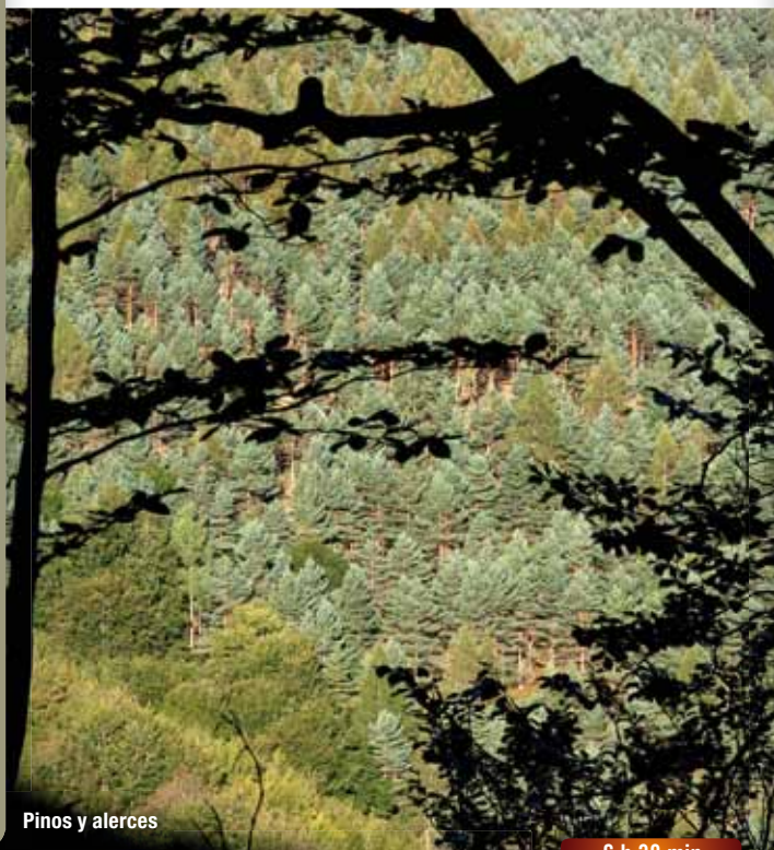
Pinos y alerces