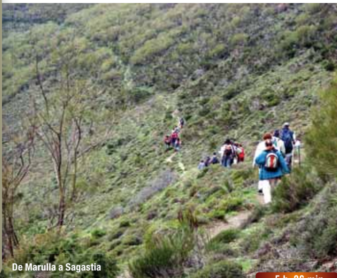
De Marulla a Sagastia

Continuar el descenso en la misma dirección, sin cambiar de vertiente y a media ladera, para bordear el Cerro de la Puerca. El camino desemboca, junto a un cortafuegos, en el Collado de Sagastia, atravesado por una pista forestal.