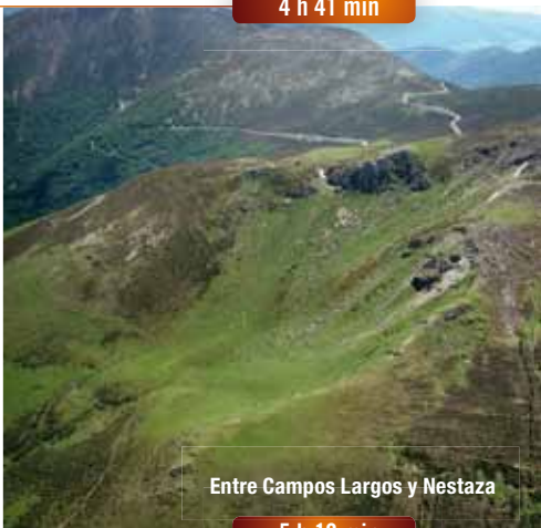
Entre Campos Largos y Nestaza

Continuar el camino entre hayas, pasando por una pedrera y descendiendo para vadear un barranco entre peñas. Seguir a media ladera por el borde superior de un bosque de hayas y abedules, hasta llegar a un collado cruzado por una alambrada con portilla.