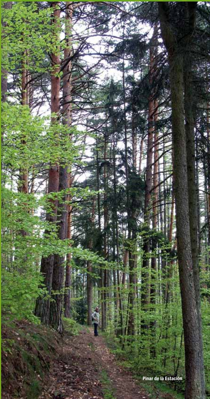
Pinar de la Estación