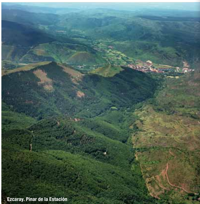
Ezcaray. Pinar de la Estación

El Sendero Altos Valles Ibéricos se inicia con una etapa larga de 23 km que recorre la Sierra de la Demanda a través de un trayecto que aprovecha, en su mayor parte, el antiguo camino que unía Ezcaray con el Monasterio de Valvanera, importante centro religioso de La Rioja. En el valle del Oja, el sendero atraviesa bosques de haya y de coníferas procedentes de repoblaciones (pinos silvestres, abetos y alerces) antes de tomar altura entre pastizales y matorrales de brezo y escoba. El paisaje está muy transformado por la presión ganadera y, en otro tiempo, por la extracción de leñas para las ferrerías de la zona. El camino antiguo bordea las cabeceras de los ríos Urdanta, en el valle del Oja, Cárdenas, Tobía y Valvanera, en el valle del Najerilla, desde donde se contemplan amplias panorámicas de los citados valles en su descenso hacia el río Ebro. Desde el Collado de Beneguerra o desde la pista que sube al Portillo de Nestaza, es posible la ascensión al pico de San Lorenzo que, con sus 2.271 m, constituye el monte más alto de toda La Rioja.