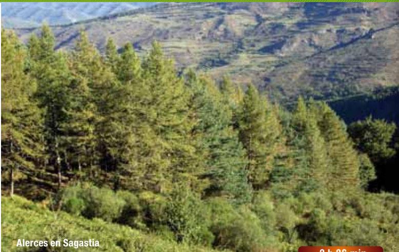
Alerces en Sagastia