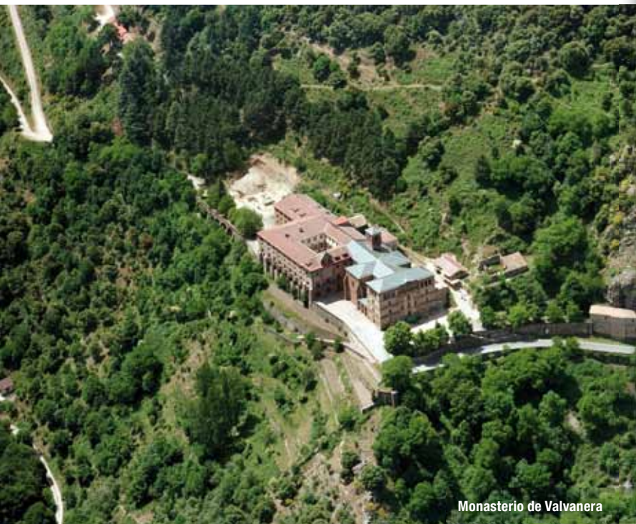
Monasterio de Valvanera

pertenece a un acuerdo en el año 1016 entre Sancho Garcés el Mayor y su suegro Sancho García, donde fijaban los límites de sus respectivos reinos.