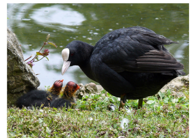
Focha común ( Fulica atra ). I.Gámez