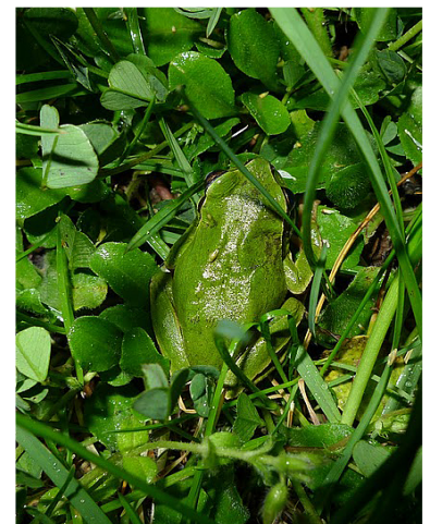
Ranita de San Antón ( Hyla arborea ). R. Zaldivar