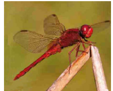
Libélula ( Crocothemis erythraea ). E. Ruiz Baltanás