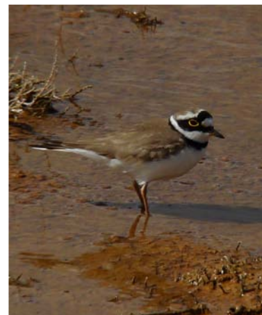
Chorlitoje chico. ( Charadrius dubius ). I. Gámez