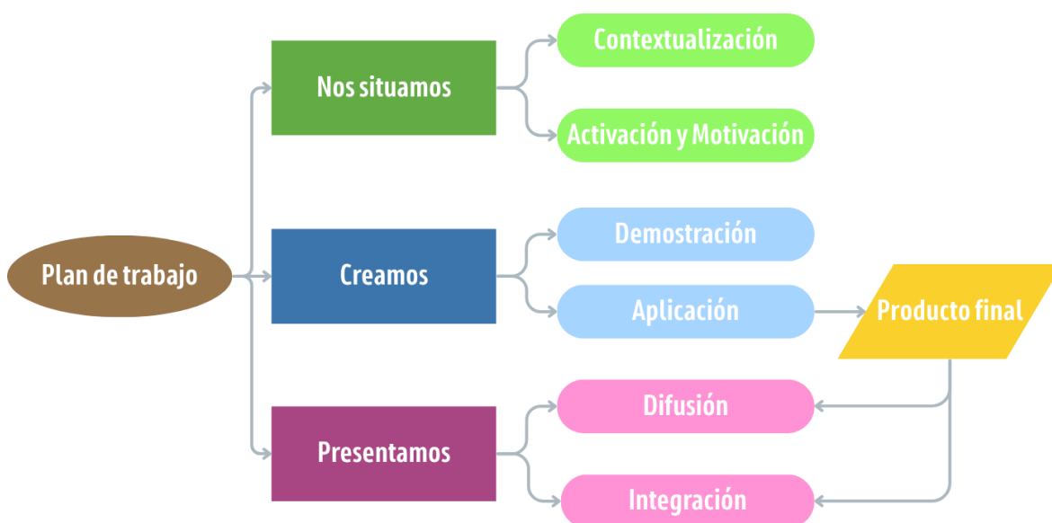
Figura 2: Fases del plan de Trabajo