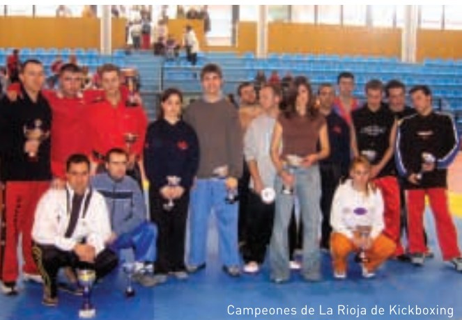
Campeones de La Rioja de Kickboxing

Este capítulo recoge los campeones de La Rioja de la última temporada, en las categorías absoluta y juvenil, de aquellos deportes cuyas federaciones han facilitado la información.