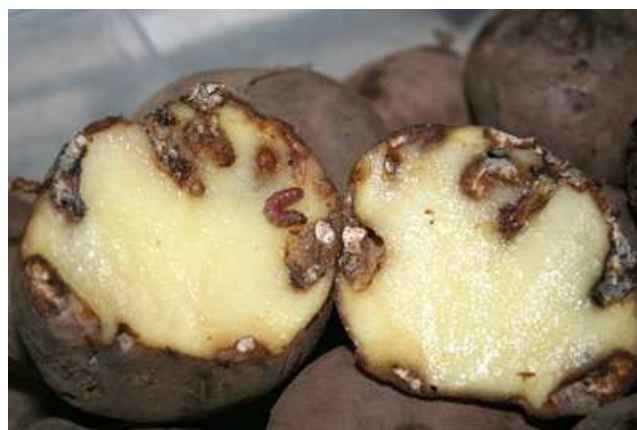
Tubérculo dañado por Tecia solanivora .

El único hospedante identificado hasta la fecha es la patata, atacando al cultivo tanto en campo como en almacén. Los síntomas que producen las larvas sobre los tubérculos, son galerías, superficiales inicialmente y que van aumentando en profundidad posteriormente. Su presencia pasa desapercibida hasta el momento de la cosecha.