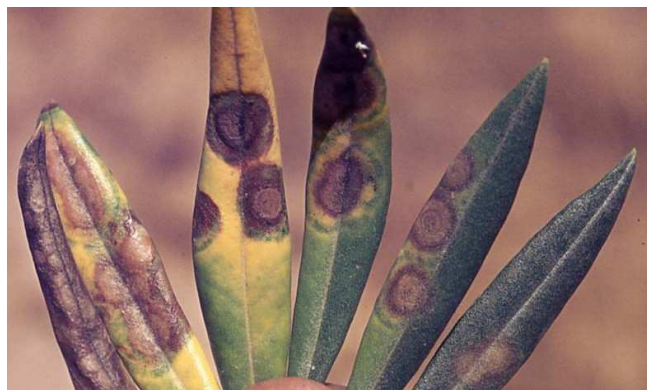
Síntomas de repilo en hoja de olivo.