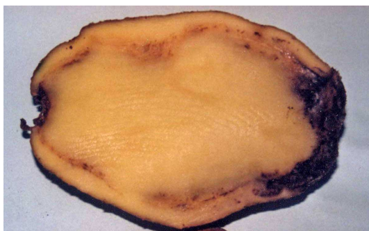
Síntomas de Clavibacter michiganensis .

Si la infección está muy desarrollada, al presionar, aparecen unas gotitas pastosas blanquecinas de mucus bacteriano en el anillo vascular.