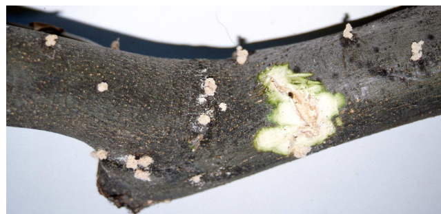
Salida de adultos de barrenillo.

Una técnica cultural de lucha eficaz contra esta plaga consiste en dejar repartidos por toda la plantación montones de restos de poda para que los barrenillos realicen en ellos la puesta y luego eliminarlos, hacia la primera quincena de mayo antes de que los nuevos barrenillos los abandonen.