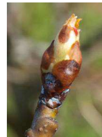
Estado C-C 3 en manzano. Estado E en melocotón. Estado C-C 3 en peral.