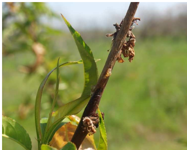
Síntomas de monilia en rama de melocotón.

Los primeros síntomas de esta enfermedad se producen en primavera provocando la marchitez de flores y brotes. Las flores quedan pegadas a los brotes. Uno de los momentos más susceptibles a esta enfermedad es la floración ya que se suelen dar las condiciones climáticas favorables para su desarrollo, por ello se recomienda realizar un tratamiento con la primera flor abierta y repetirlo al inicio de caída de pétalos con uno de los siguientes productos: