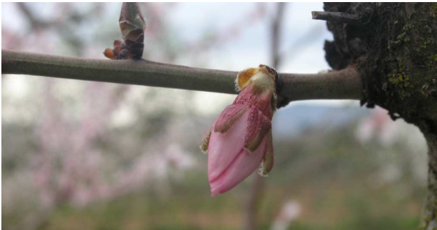
Estado fenológico D.

En el caso del almendro para luchar eficazmente contra esta enfermedad debe realizarse un tratamiento en el momento en que se observen los pétalos de las flores (estados fenológicos C/D), siendo generalmente suficiente para combatirla.