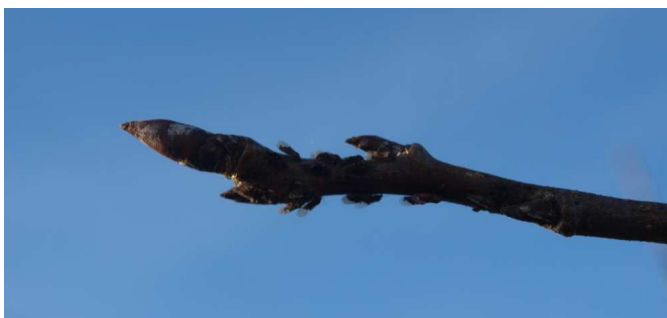
Adultos de psila.