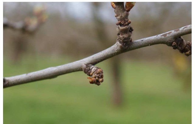
Agallas junto a una yema.

En próximos boletines se indicará el momento oportuno de tratamiento, así como los productos a emplear.