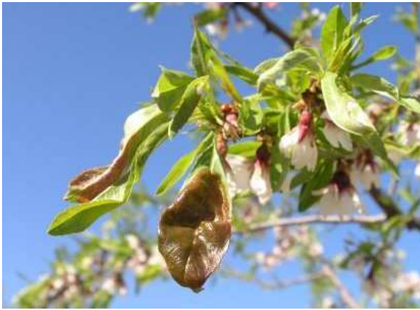
Síntomas de abolladura en almendro.

En el caso del almendro para luchar eficazmente contra esta enfermedad debe realizarse un tratamiento en el momento en que se observen los pétalos de las flores (estados fenológicos C/D), siendo generalmente suficiente para combatirla.