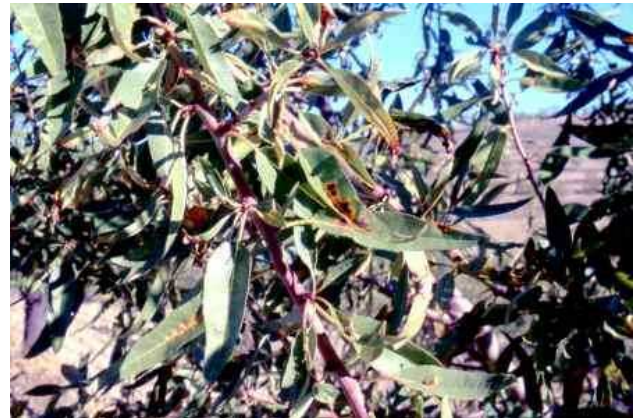
Síntomas de mancha ocre en almendro.

A pesar de que las infecciones por estos hongos se producen a caída de pétalos, no es hasta finales de mayo cuando aparecen los primeros síntomas (éstos no se aprecian hasta pasadas cuatro o cinco semanas después de las contaminaciones). Si este periodo coincide con lluvias los daños pueden ser importantes, por ello en caso de que se den esas condiciones es recomendable realizar tratamientos con tiram (pr.común, solo hasta floración) para mancha ocre, y desde caída de pétalos hasta finales de mayo con boscalida+piraclostrobin (Signum-Basf), folpet y compuestos de cobre (pr. comunes) para cribado.