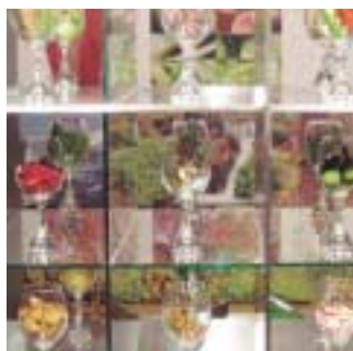
Composición de texturas, aromas, sabores y colores en copas de Rioja.