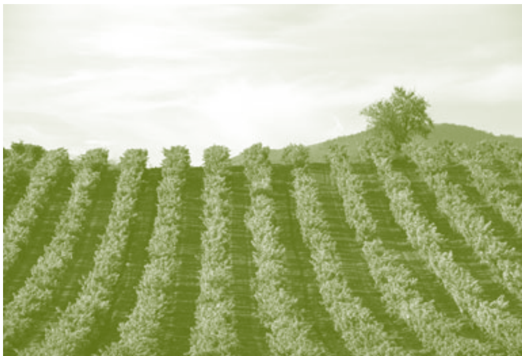
Está previsto el arranque de 175.000 hectáreas de viñedo en los próximos tres años en toda la UE.

La OCM del Vino aprobada por los ministros de la Unión Europea entrará en vigor el 1 de agosto de este año, aunque algunas medidas relacionadas con calidad, etiquetado y prácticas enológicas se pondrán en marcha el 1 de agosto de 2009. Las medidas contempladas en la reforma pretenden hacer más competitivo al sector, equilibrando la oferta y la demanda y eliminando los mecanismos artificiales de intervención en el mercado (destilaciones).