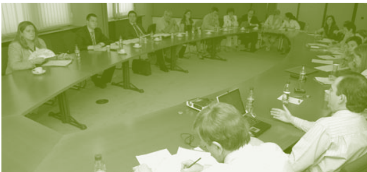
El consejero de Agricultura se dirige en Bruselas a organizaciones de productores, empresarios y eurodiputados.

propone flexibilizar la actual política de etiquetado teniendo en cuenta las políticas de la OMC. Esta consideración pasa por abandonar la distinción entre reglas de etiquetado de los vinos con y sin indicación geográfica y, sobre todo, facilitar que los vinos sin IG puedan indicar la variedad y añada, de forma que puedan competir mejor en el mercado internacional con los vinos del “Nuevo Mundo” donde lo que caracteriza a los vinos es la variedad de la uva.