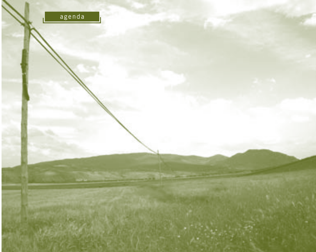
El cereal es el cultivo predominante en el municipio.

Otros cultivos leñosos de importancia son el almendro, con 182 hectáreas y el olivo para aceituna de aceite, con 50 hectáreas, que deberán ser tratados con especial atención debido a sus características especiales: edad de las plantaciones, variedades, parcelas de pequeña dimensión, etc.