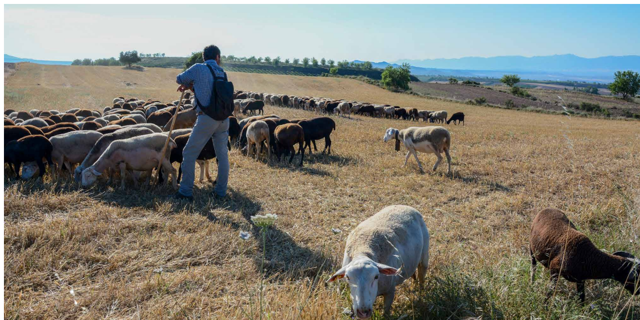
Una de las nuevas ayudas asociadas va dirigida a los ganaderos de ovino y caprino sin base territorial que pastan rastrojos y barbechos. Ch. Díez

En el nuevo periodo se va a habilitar una reserva nacional excepcional de derechos que podrán solicitar aquellos agricultores que, siendo agricultores activos y ejerciendo la actividad agraria desde 2015, no hayan participado nunca en el sistema de derechos de pago, como determinadas explotaciones de viñedo, frutas, hortalizas u otros sectores. Otra de las novedades es la incorporación de un “cuaderno digital de la explotación” para que los productores puedan incorporar y mantener actualizados los datos sobre la gestión de la explotación necesarios para garantizar el cumplimiento de las obligaciones legales y de los compromisos de prácticas sostenibles que hayan asumido.