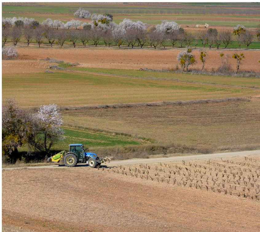
La reforma establece un pago redistributivo por explotación que favorece a las de tamaño medio. Ch. Díez