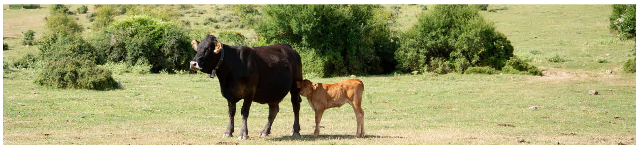
El aprovechamiento de pastos al menos 120 días al año es una de las prácticas recogidas en los eco-regímenes para ganaderos de extensivo.

(*) Se está barajando la posibilidad de retrasar la aplicación de las BCAM 7 y 8 debido a la guerra en Ucrania.