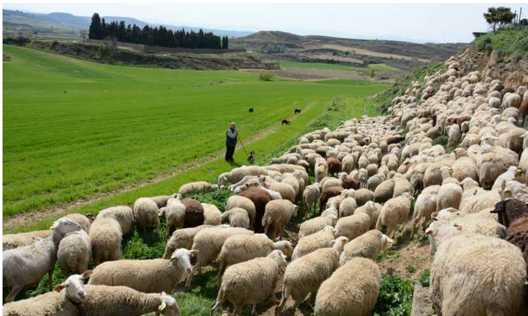
Manejo en el valle, donde las ovejas pastan unas horas al día aprovechando recursos herbáceos del terreno.

Esta medida se traduce en un mayor número de horas trabajadas por el pastor, un incremento de los costes de alimentación, ya que se deben realizar aportes