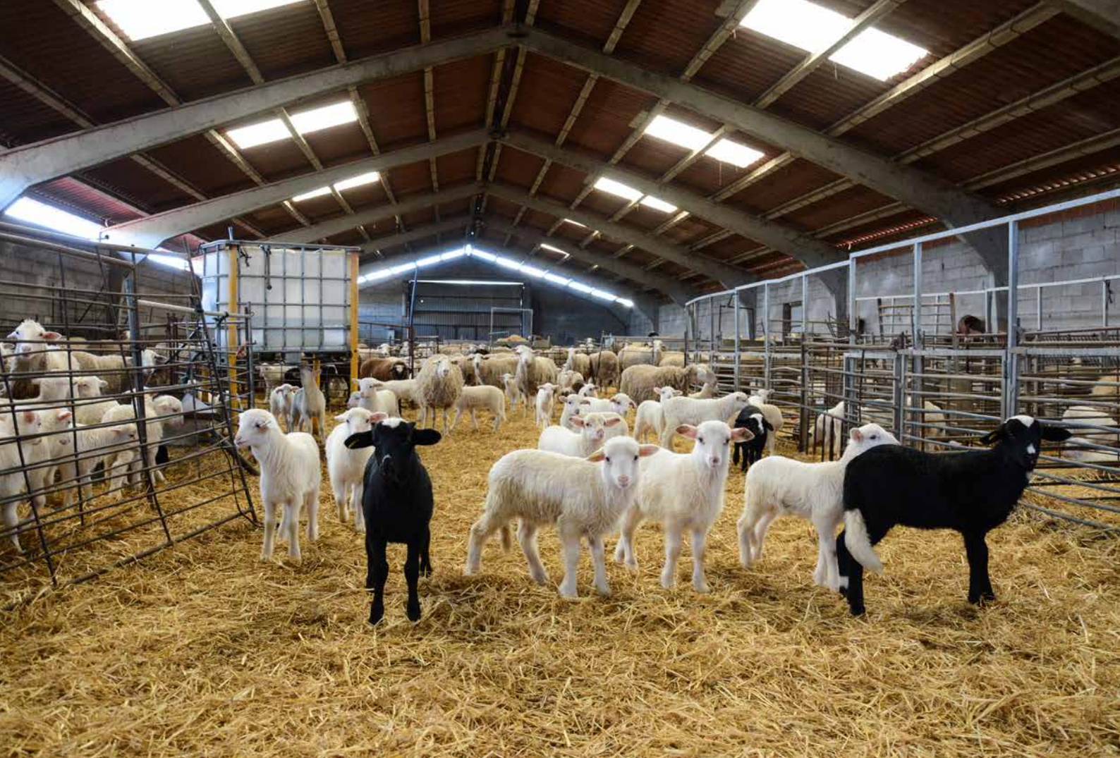
Corderos lechales en una explotación del valle.