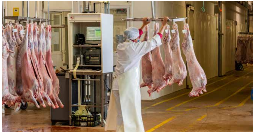
Dos tercios de los corderos criados en La Rioja son sacrificados en mataderos de la región.

criados vivos por oveja y año). Por último, debe considerarse la pérdida de la subvención asociada al ganado ovino, ya que, al desaparecer la oveja, el ganadero no tiene derecho a cobrarla.