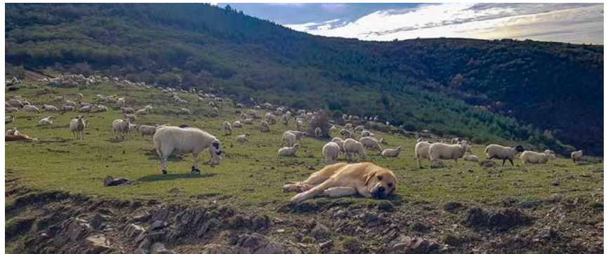
El mantenimiento de mastines supone un gasto a las explotaciones de sierra del 7% del total.