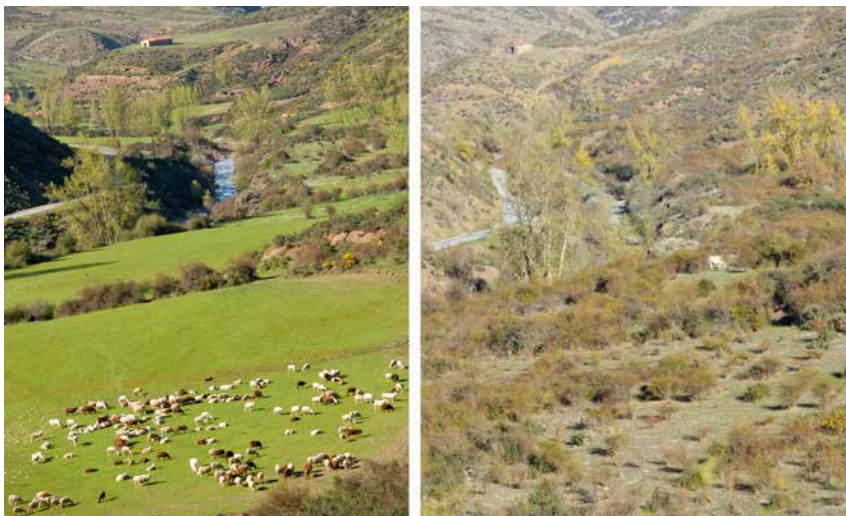
A la izquierda, pastizal en Robres del Castillo en primavera de 2007; a la derecha, la misma zona llena de espinos en otoño de 2022.

El análisis por comarcas muestra diferencias sustanciales entre unas y otras: en Rioja Media (de Ausejo a Navarrete y valles del Jubera y de Ocón) se ha perdido el 82,7% de los animales (ahora no llegan a 7.000); por el contrario, su zona de Sierra (los dos Cameros) ha acusado el menor descenso de censos (-32,7% y 9.000 animales), aunque también es cierto que es la comarca que menos cabezas tenía. Rioja Baja (de Tudelilla a Alfaro) es la comarca donde pastan más animales, antes y ahora; cuenta con casi 20.500 cabezas, un 65% menos que en 1995. Su Sierra, la comarca menos extensa y con solo diez municipios, no ha acusado tanto descenso (-40%) y tiene 9.900 cabezas. Las comarcas de Rioja Alta y Sierra Rioja Alta cuentan cada una con unos 11.500 animales (algo más en la sierra) y unos porcentajes de descenso del 69,7 y del 60,3%, respectivamente (cuadro 1).