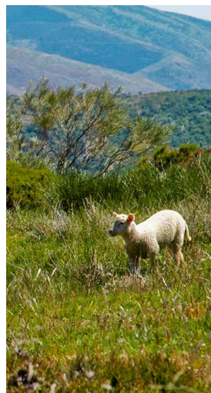
Cordero criado para pasto, que comienza a comer en los prados a partir del mes y medio de vida.

En cuanto a la otra categoría estudiada, el cordero de pasto, cabe decir que son necesarios 112,99 € para criar cada cordero, lo que lo convierte en el tipo de animal con mayores costes de producción de los analizados. Eso sí, si en vez de a un ejemplar, los costes obtenidos hacen referencia al peso, resulta que es la carne de cordero con menores costes de producción, 7,21 €/kg canal, bastante por debajo de la carne de lechal.