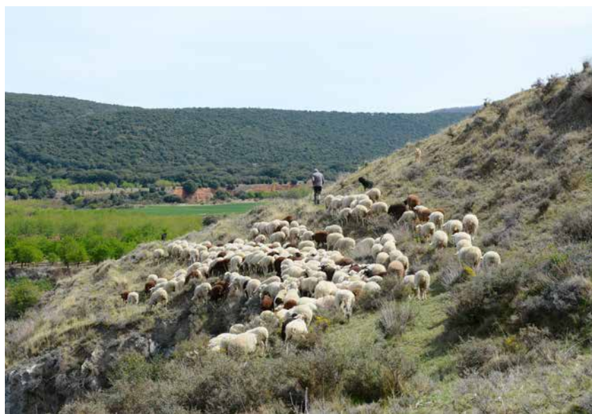
Pastoreo en una zona de transición valle-sierra.

La caída de censos de esta ganadería extensiva tan ligada al territorio, en el que