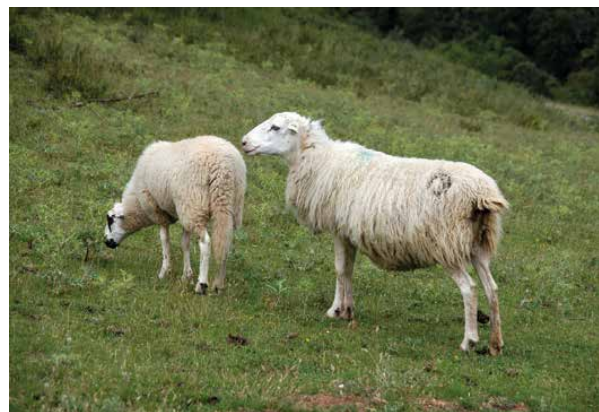
Cada oveja tiene de media entre 1,1 y 1,3 corderos por parto.