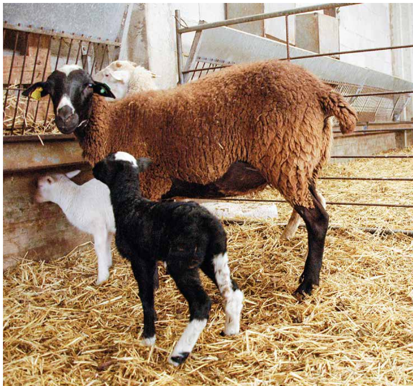
Dos ovejas amamantan a sus crías en el corral.

Hace muchos años que la tecnología y la investigación han experimentado con técnicas diseñadas para aumentar el número de partos, venciendo los períodos de anoestro, y, al mismo tiempo, incrementar la prolificidad, como el uso de tratamientos hormonales en la oveja, que han dado muy buenos resultados en condiciones adecuadas de manejo. Así mismo, las prácticas de selección y mejora genética realizadas por los centros de selección y testaje de las razas de ganado ovino han conseguido mejoras evidentes en muchos aspectos, pero en el aumento de la prolificidad los resultados han sido limitados dada la baja heredabilidad del carácter.