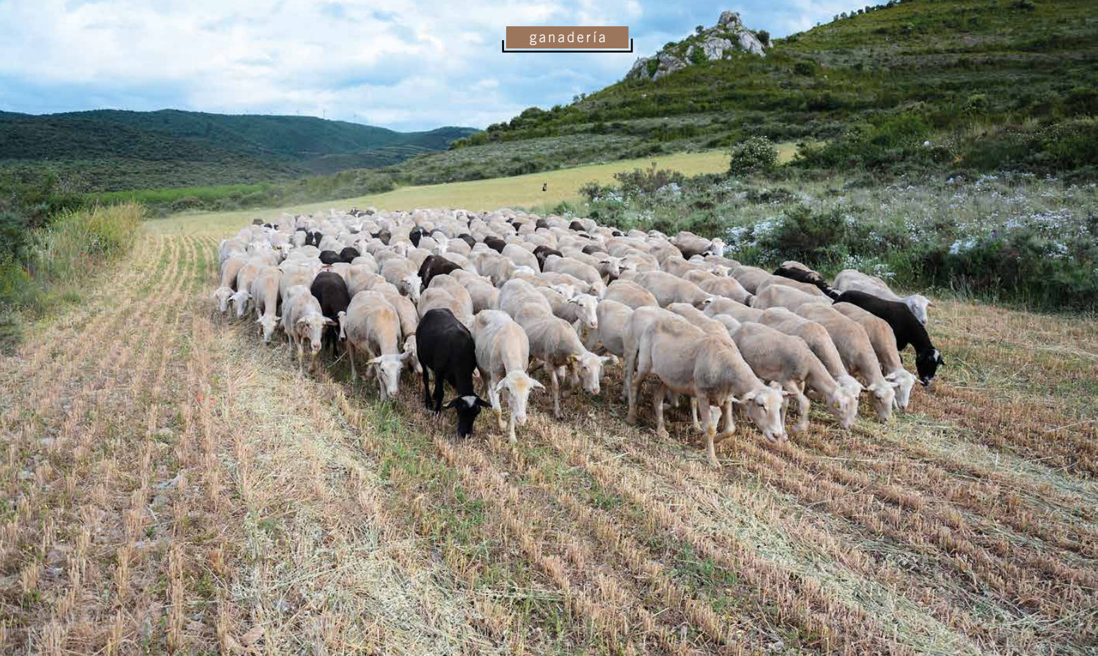
Pastoreo tradicional, aprovechando la hierba de los rastros.