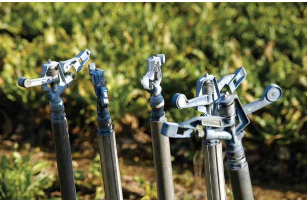
El cultivo se somete a unos 15 riegos a lo largo del año.