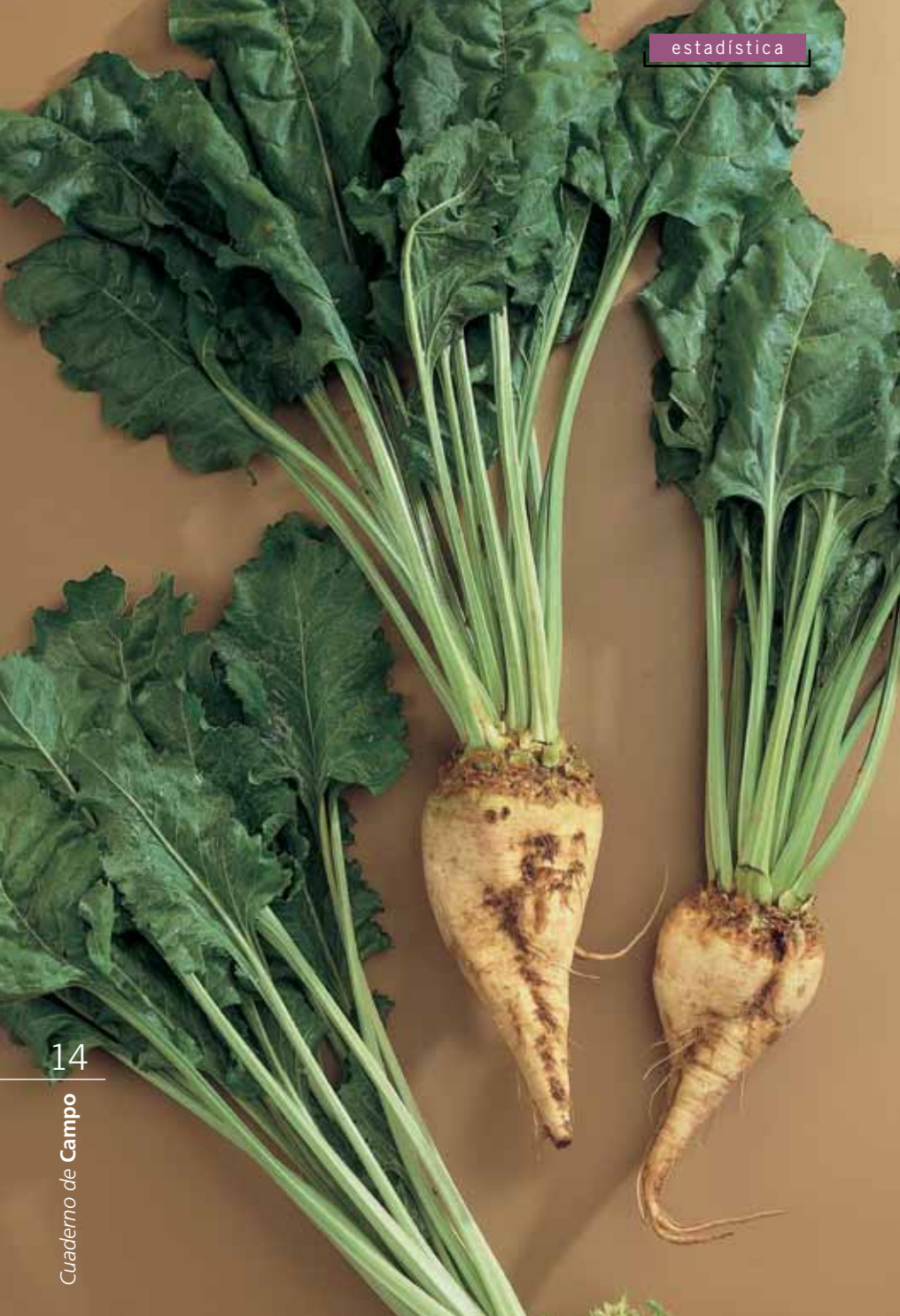
La mayor parte de la remolacha de La Rioja se cultiva en producción integrada. / Sergio Aja