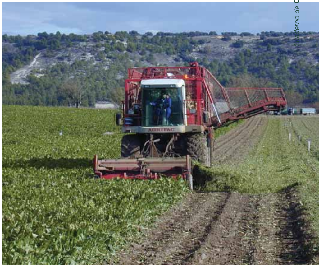
Corte de la hoja previo a la recogida.

Habitualmente se realiza un tratamiento herbicida preemergencia y tres post-emergencia, a los que ocasionalmente se incluyen tratamientos contra plantas compuestas y contra plantas de hoja estrecha. También se realizan dos pases de tratamiento contra pulgón y otros tres fungicidas combinados ge-