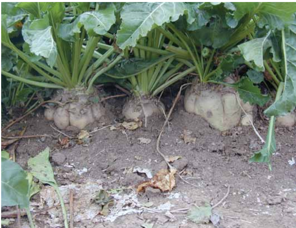
El rendimiento medio se sitúa en 103,6 t/ha.

En cuanto al rendimiento, hay que tener presente que el interés del cultivo radica en maximizar la producción de sacarosa. Ha de tenerse en cuenta por tanto el rendimiento de remolacha logrado y el grado polarimétrico, que indica el porcentaje de sacarosa que contiene la raíz. Así, durante la campaña 2011/2012 se logró una media de 103,6 toneladas de remolacha por hectárea con 17,88 grados polarimétricos, lo que equivale a 18,52 toneladas de sacarosa por hectárea.