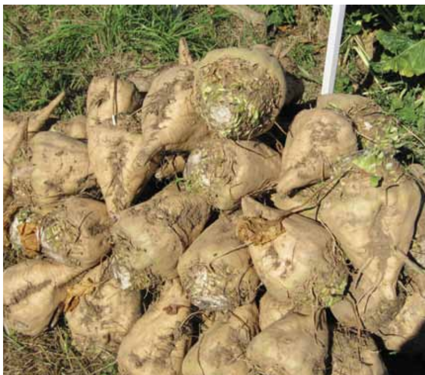
Recogida de remolacha.

El coste de producción de remolacha se sitúa en 3.678,19 €/ha, o lo que es lo mismo, para el rendimiento medio obtenido en la campaña 2011/2012, en torno a 35,47 €/t. El mayor gasto corresponde al agua de riego y al alquiler de maquinaria con cerca de un 13% cada uno, seguido de fitosanitarios y de la renta de la tierra con un 12% respectivamente (gráfico 2). Los agricultores obtuvieron durante esta campaña un ingreso de 46,38 €/t de media, de los cuales una tercera parte corresponde a ayudas.