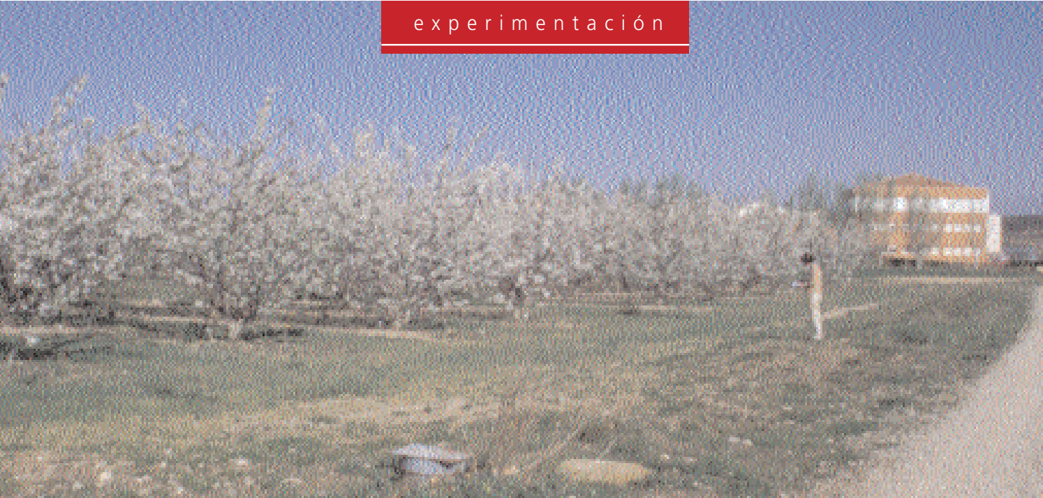
La parcela experimental está ubicada en la Finca Valdegón, en el CIDA.