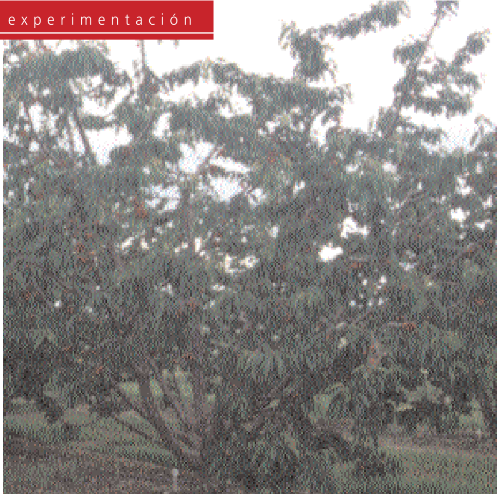
Árbol en producción en el campo de ensayo.