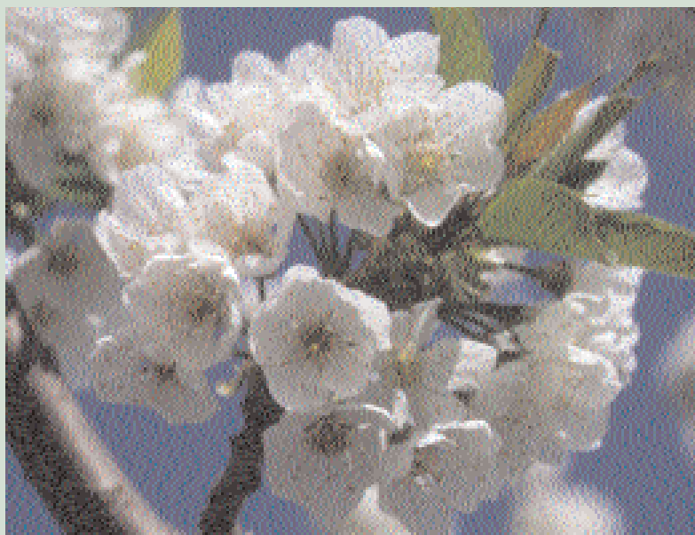
Detalle de inflorescencia.