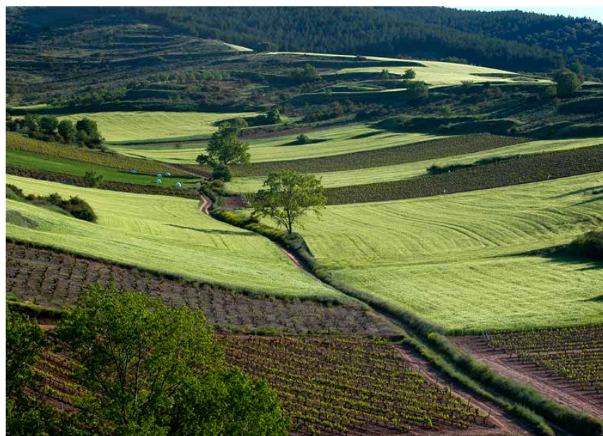
Con este nuevo sistema, la información de cada explotación estará permanentemente actualizada. Ch. Díez

Actualmente, la Administración ha puesto a disposición de cada viticultor, en el aplicativo informático, la información