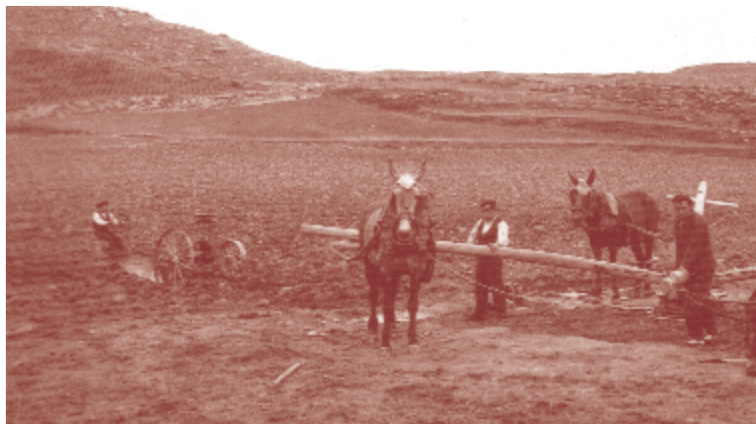
Labrando la tierra con un malacate para la plantación de viña en los años de la detección de la filoxera.