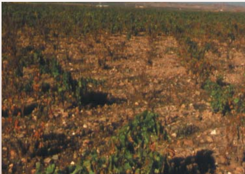
Viñedo de Rioja Baja afectado por filoxera al no estar injertado.