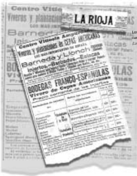
Los anuncios de venta de cepas americanas eran frecuentes en la prensa de la época. (La Rioja, 3 de Enero de 1904)