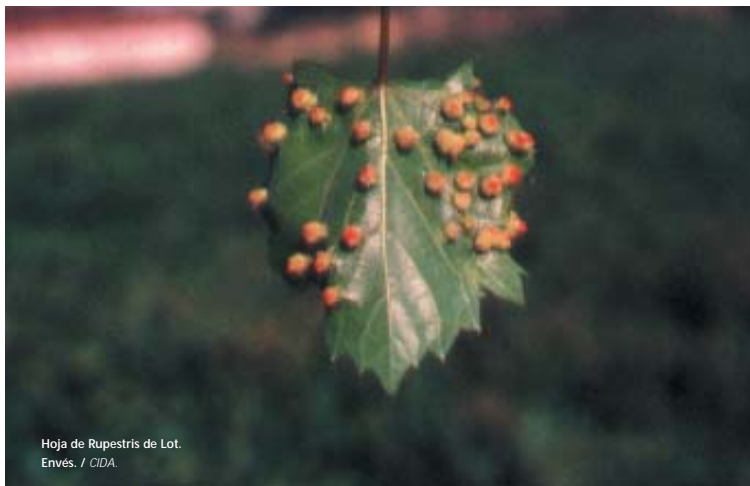
Hoja de Rupestris de Lot. Envés.

La presencia del insecto en Navarra obligaba a elevar el canon a 1 peseta por hectárea, con el consiguiente aumento de dificultades para el cobro. Por ello, el 12 de abril de 1898, la Diputación Provincial instaba de nuevo a los Ayuntamientos (que eran los que debían realizar el cobro para su posterior envío a la Diputación) a cumplir con la Orden correspondiente. Se menciona la cifra de 47.536 pesetas: es decir, que la superficie de viñedo en tal año era en La Rioja 47.536 hectáreas. Esta cifra es inferior a la indicada en la Memoria del Servicio Vitícola de la provincia de La Rioja publicada en 1912. En ella se establece la distribución de superficie de viñedo por Partidos Judiciales en 1898, como se aprecia en el cuadro 1.