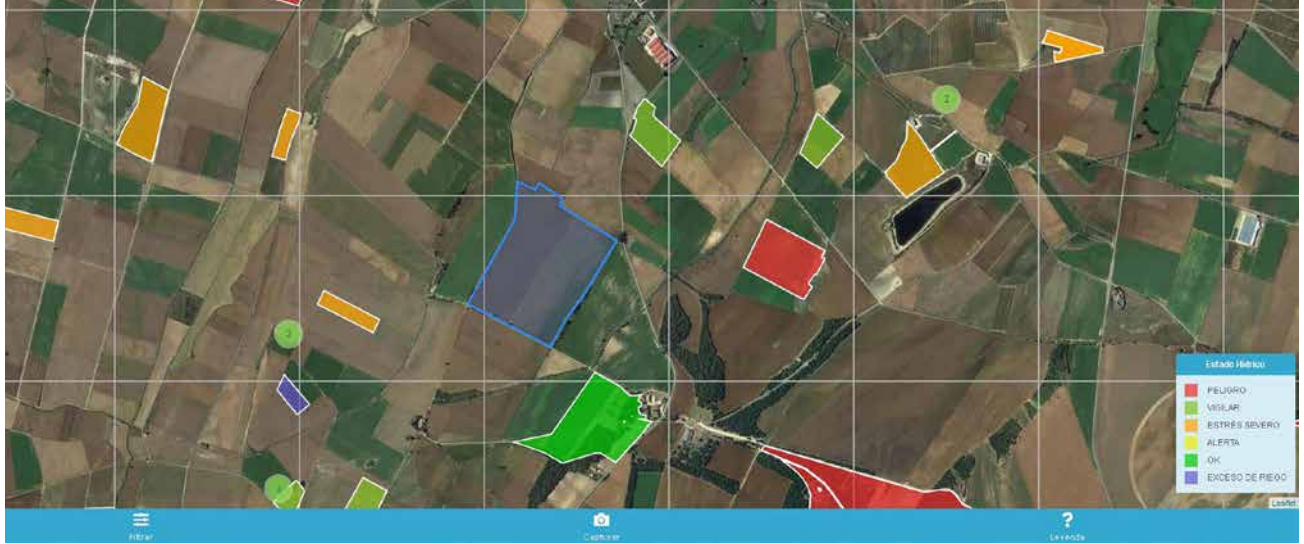
El mapa de estado hídrico permite saber de un vistazo el estado hídrico de las parcelas.

El balance hídrico es una de las herramientas disponibles para regar óptimamente los cultivos. Para usarlo es necesario realizar de forma frecuente, idealmente cada día, el cómputo o balance entre las entradas de agua en el suelo, por riego o lluvia, y las salidas debidas al consumo del cultivo, pérdidas por drenaje u otras causas.