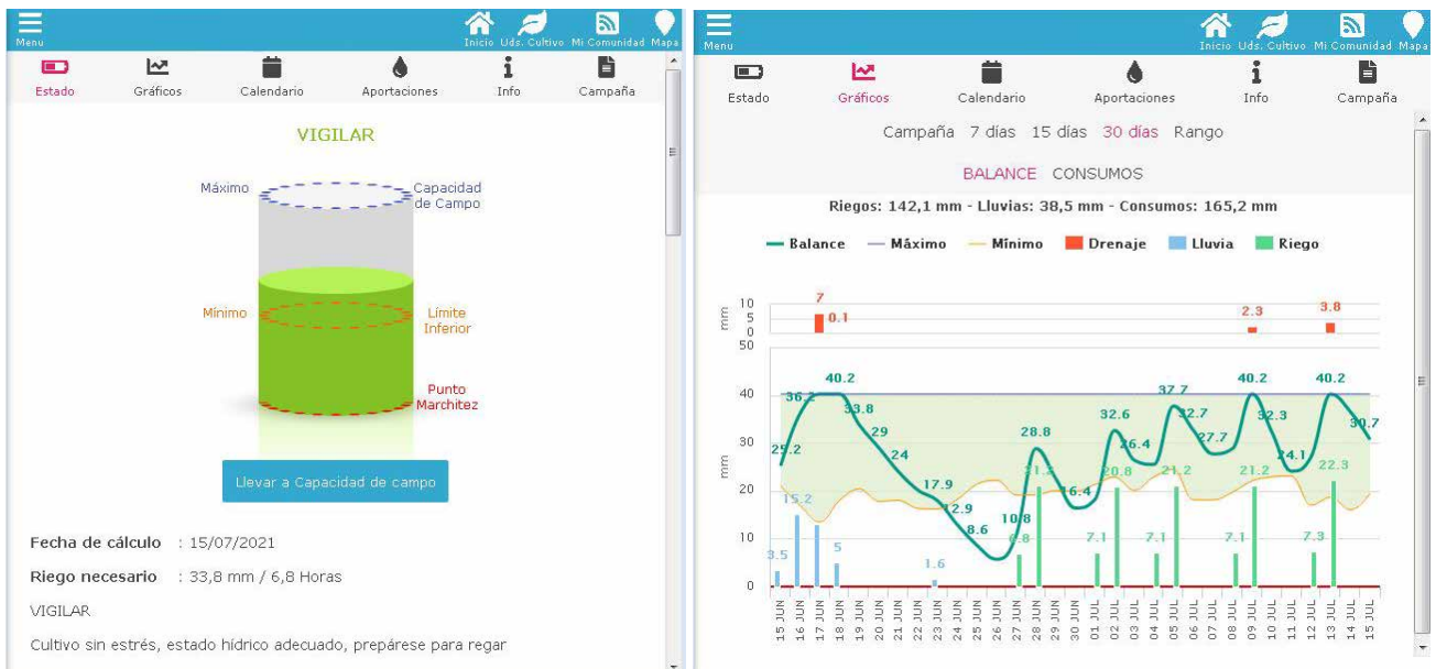
La aplicación permite analizar la situación hídrica del suelo mediante diferentes gráficos. La figura de la izquierda muestra la situación actual y ofrece información para tomar la decisión de riego. En la figura de la derecha se puede ver la evolución temporal incluyendo los riegos realizados.

Estas experiencias permitieron establecer las bases para diseñar y poner en marcha un sistema capaz de recopilar la información necesaria y realizar automáticamente el cálculo de balance hídrico para los regantes. Así, a finales de 2016, la Comunidad de Regantes del sector 3º tramo III de la margen izquierda del Najerilla, la Asociación de Investigación para la Mejora del Cultivo de la Remolacha Azucarera (AIMCRA) y el Servicio de Información Agroclimática de La Rioja (SIAR) de la Consejería de Agricultura, se constituyeron como grupo operativo al amparo de la medida 16 del Programa de Desarrollo Rural para ejecutar el proyecto mencionado, con