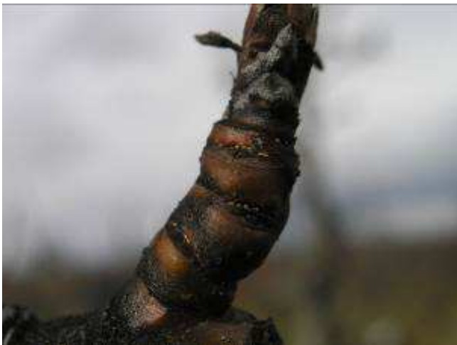
Puesta de psila invernal.