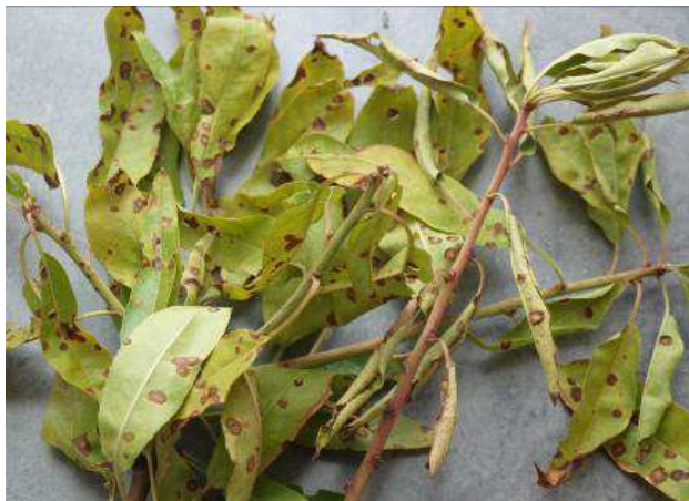
Daños por cribado.

A pesar de que las infecciones por estos hongos se producen a caída de pétalos, no es hasta finales de mayo cuando aparecen los primeros síntomas (éstos no se aprecian hasta pasadas cuatro o cinco semanas después de las contaminaciones). Si este periodo coincide con lluvias los daños pueden ser importantes, por ello en caso de que se den esas condiciones es recomendable realizar tratamientos desde caída de pétalos hasta finales de mayo con metil-fiofanato (Enovit Metil-Sipcam; Cercobin 70 WG-Certis) boscalida+piraclostrobin (Signum-Basf) y compuestos de cobre (pr. comunes).