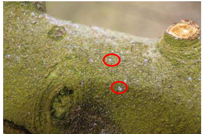
Caparazones de la cochinilla del Piojo San José en rama de ciruelo.

campaña y en prefloración. El momento más adecuado para tratar esta plaga es antes de la floración. Se deberá recubrir bien todo el árbol con el tratamiento. El aceite de parafina puede contribuir al control de la plaga.