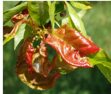
Abolladura en melocotón.

Pasado este momento , si las condiciones climáticas son favorables (lluvias y temperaturas suaves), el parásito invadirá los brotes y las hojas, presentando entonces grandes dificultades para combatirlo .