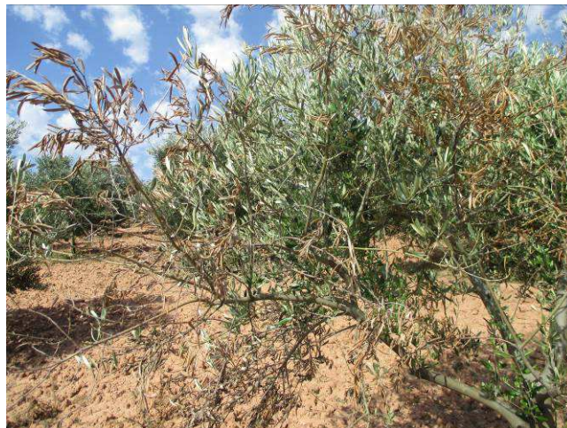
Rama infectada por verticilosis, con hojas secas adheridas a la misma.

En la actualidad no existen métodos químicos de control eficaces. Dado que hay una gran cantidad de inóculo en las partes secas del árbol, que al caer incrementan la cantidad de hongo en el suelo, es importante cortar las partes sospechosas de estar infectadas y eliminarlas mediante incineración, y no triturando e incorporándolas a la parcela.