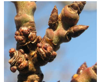
Agallas junto a las yemas

Estos ácaros viven en el interior de las agallas que ellos mismos generan, por lo que los tratamientos químicos en invierno son ineficaces. Aunque, si el nivel de agallas es bajo, se puede actuar en estos momentos eliminando en la poda las ramas afectadas. Los tratamientos químicos se realizarán en primavera cuando se produce la apertura de las agallas y la salida de los ácaros.