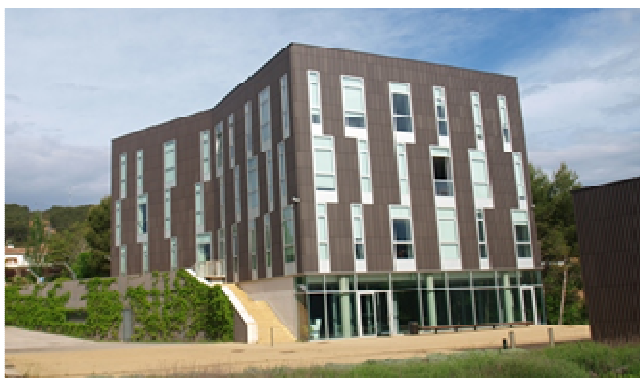
La Sección de Protección de Cultivos está ubicada en la Finca de La Grajera (Logroño), en la tercera planta del edificio administrativo del ICVV.

El pasado año no fue posible editar todos los números del boletín en formato papel, debido a la COVID-19, emitiéndose sólo en formato digital. Por ello, desde la Sección de Protección de cultivos, se recuerda a los usuarios que pueden solicitar el cambio de modalidad de papel a digital, llamando al teléfono indicado o enviando un correo.