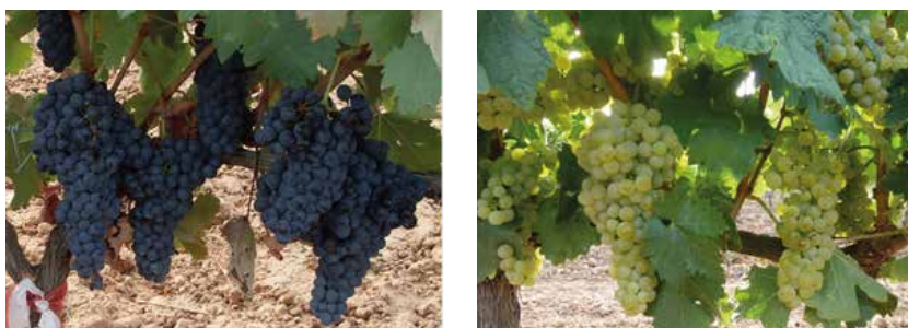
Figura 3. Racimos de Tempranillo y Tempranillo Blanco. Los racimos de Tempranillo Blanco suelen ser un poco más pequeños, más sueltos y con frutos de menor tamaño que Tempranillo.

con menor presencia de hombros que en Tempranillo; sus bayas más pequeñas y con menor número de pepitas, si bien éstas son por lo general de mayor tamaño (figura 3). Estas características suelen relacionarse con valores de peso de racimo y de la baya relativamente bajos del orden de 180 g y 1,7 g, respectivamente, alcanzando niveles medios de rendimiento en torno a los 3,3 kg/planta.