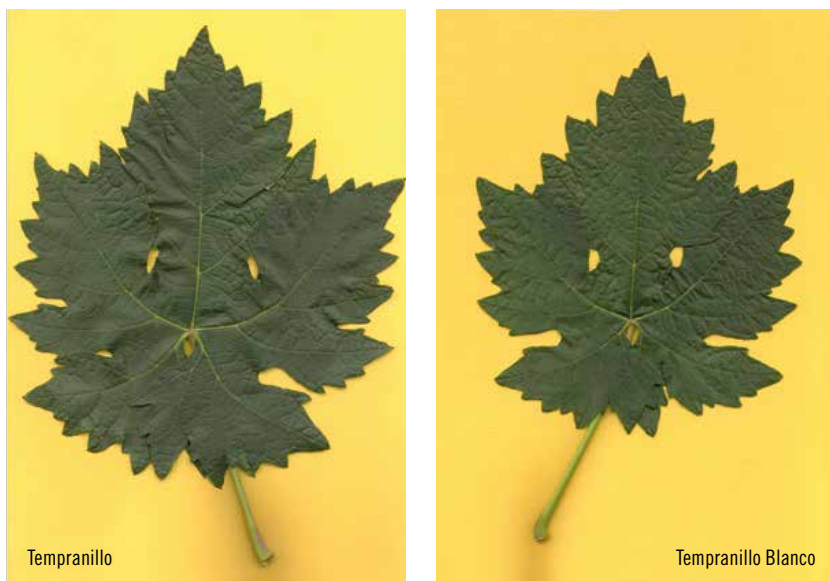
Figura 2. Hoja de Tempranillo y Tempranillo Blanco. La fotografía muestra una gran similitud en la forma y una tendencia a un tamaño menor en las hojas de Tempranillo Blanco.