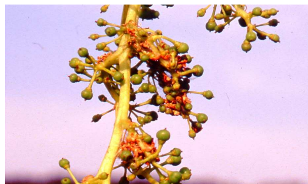
Daños de primera generación de polilla del racimo.

Por tanto, no se recomienda realizar tratamientos para esta generación , salvo en parcelas problemáticas. En estos casos excepcionales, se puede utilizar algún producto de los indicados en la tabla: