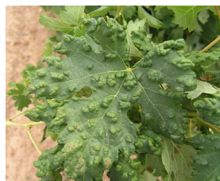
Síntomas de erinosis.