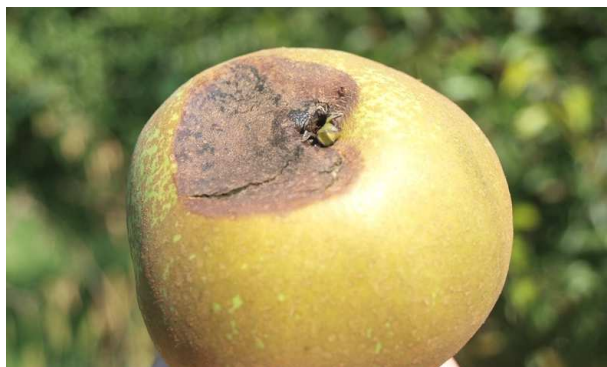
Daños en pera causados por filoxera.