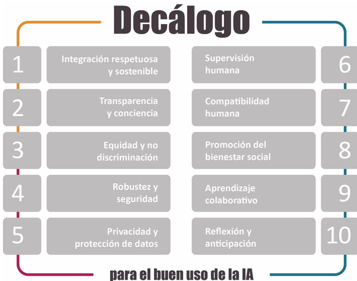
Ilustración 3. Decálogo para el buen uso de la IA (INTEF, 2024).

Estos valores, acciones y principios, ya recogidos en las recomendaciones y reglamentos existentes, como en la Recomendación sobre la ética de la inteligencia artificial de UNESCO 10 o en las Directrices éticas sobre el uso de inteligencia artificial (IA) y datos en la enseñanza y el aprendizaje para educadores de la Comisión Europea 11 , han de servir como guía para todos los agentes involucrados en este proceso: docentes, estudiantes, centros educativos, empresas tecnológicas y administraciones públicas.