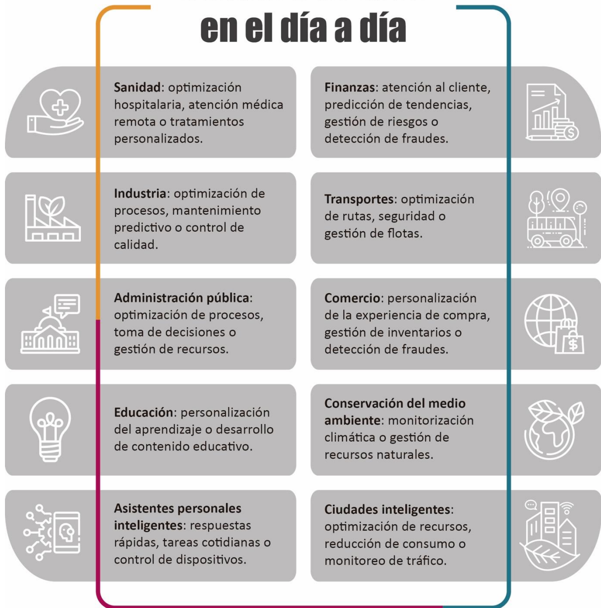
Ilustración 1. Ámbitos de la IA en el día a día (INTEF, 2024).