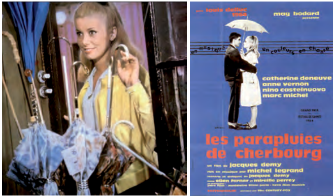
Les parapluies de Cherbourg. Cartel de la película.

Francia, Alemania. 1964. 91 min. VOSE (Francés)