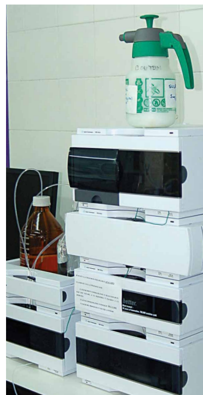
Cromatógrafo de líquidos (HPLC), equipo utilizado para el análisis de aminoácidos.

El contenido de aminoácidos totales y de aminoácidos totales sin prolina en los mostos aumentó debido a las aplicaciones foliares de riboflavina. Fue la dosis más baja de riboflavina (Rf1) el tratamiento más efectivo (figura 2A). El aminoácido mayoritario en los mostos fue la arginina (Arg), observándose que ambos tratamientos favorecieron su síntesis por la planta, aunque en mayor medida cuando se aplicó la dosis más baja de dicha vitamina (figura 2B). En el caso de prolina (Pro) y glutamina (Gln), compuestos que se encontraron también en altas concentraciones, su contenido en las muestras fue mayor con el tratamiento Rf1 que con los tratamientos control y Rf2 (figura 2B). Una tendencia similar se observó para GABA, histidina (His), triptófano (Trp) y leucina (Leu) (figura 2C). El contenido