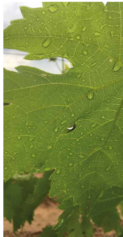
Las hojas de las cepas recibieron una solución acuosa de riboflavina. / Ch. Díez

Otros autores también han encontrado un aumento de la concentración de aminoácidos en el mosto cuando se aplicaron tratamientos foliares de diferentes fuentes de nitrógeno a los viñedos (Garde-Cerdán et al. , 2014; Gutiérrez-Gamboa et al. , 2017; Pérez-Álvarez et al. , 2017), o incluso cuando se utilizó un elicitor como tratamiento foliar (Garde-Cerdán et al. , 2016). Cabe destacar que con los tratamientos foliares con riboflavina, el número de aminoácidos que aumentó su concentración respecto al control fue mayor. En esta misma línea, junto con el aumento de la concentración individual de aminoácidos, la acumulación de Arg fue superior a la de Pro, mejorando el contenido en el mosto de nitrógeno asimilable, ya que la Pro es un aminoácido que las levaduras no son capaces de metabolizar en condiciones normales de fermentación (Bell y Henschke, 2005). Además, His, Trp, Tyr, Phe y Met son precursores, respectivamente, de histaminol, triptofol y tirosol, estos dos últimos con importante actividad antioxidante, 2-feniletanol, responsable de un agradable aroma a rosas y metionol, que confiere al vino notas a patata cocida.