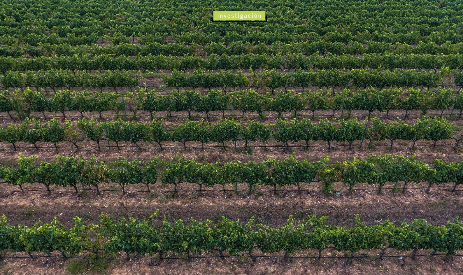
Viñedo conducido en espaldera.