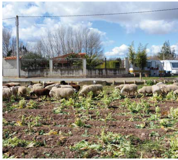
El rebaño aprovecha los restos de la cosecha de berzas en la ribera del Iregua.