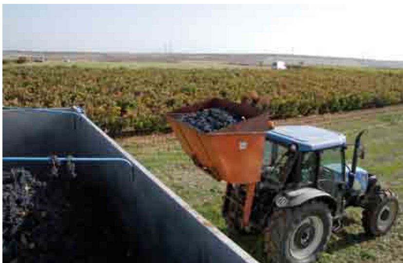
Descarga con el sacauvas en una vendimia manual.

La contratación por horas implica cierta inquietud por parte del viticultor, que tiene interés en que el tiempo se