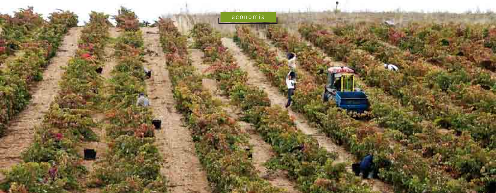
El coste medio de una vendimia tradicional de uva tinta está en torno a los 63 €/tonelada. / Ch. Díez