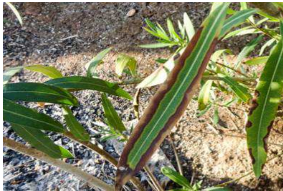
Síntomas en Adelfa ( Nerium oleander ).