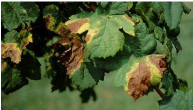
Necrosis y marchitamiento provocado por la enfermedad de Pierce en viñedo.

El rango de hospedantes de esta bacteria es muy amplio, pudiendo afectar a más de 300 especies, en muchas de las cuales no presenta síntomas aparentes pero pueden actuar como reservorio de la misma. Entre las especies en las que provoca daños se encuentran: vid ( Vitis spp.), almendro ( Prunus dulcis ), melocotón ( P. pérsica ), cerezo ( P. avium ), ciruelo ( P. domestica ), olivo ( Olea europaea ), café ( Coffea spp.), lechera del cabo ( Polygala myrtifolia ), alfalfa ( Medicago sativa ), Quercus , romero ( Rosmarinus officinalis ), etc.