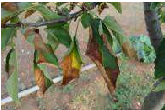
Síntomas en cerezo ( Prunus avium ) en el Sur de Italia