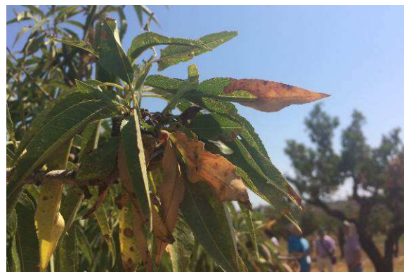
Síntomas en almendro producido por Xylella fastidiosa en Alicante.