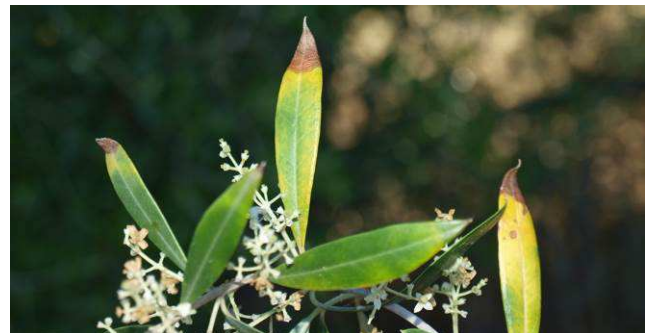
Síntomas observados en olivos en Mallorca.

Estos síntomas no siempre se relacionan con la enfermedad ya que pueden asociarse con estrés hídrico o carencias nutricionales. Ante cualquier sospecha deben realizarse análisis en el Laboratorio Regional de La Grajera.