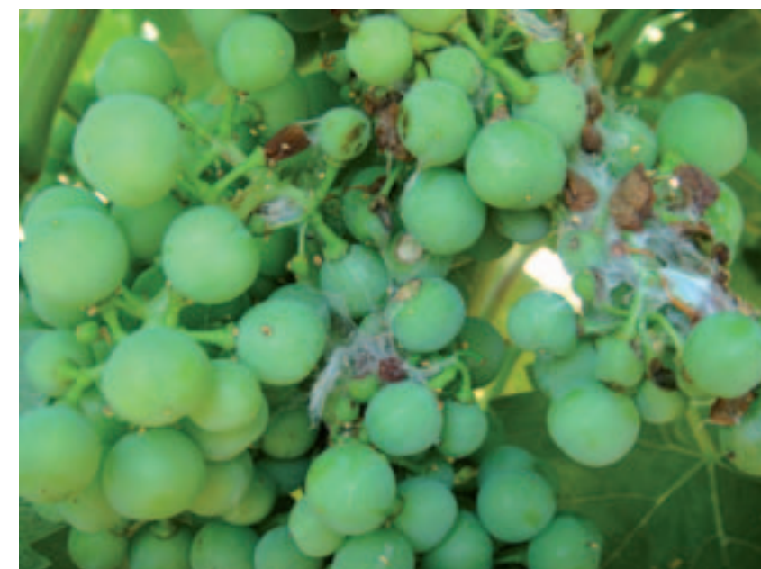
Glomérulos en racimo. / Guillermo Martínez Ruiz-Clavijo