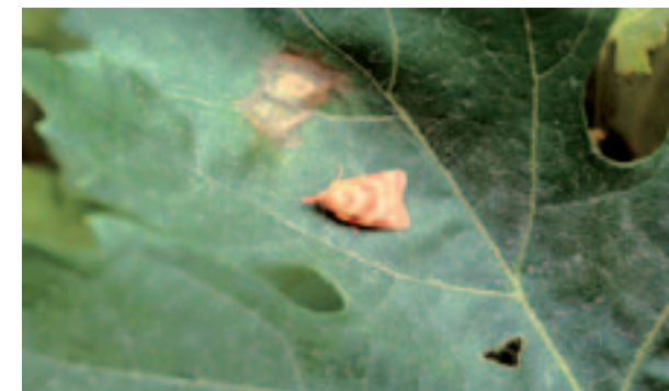
Adulto.