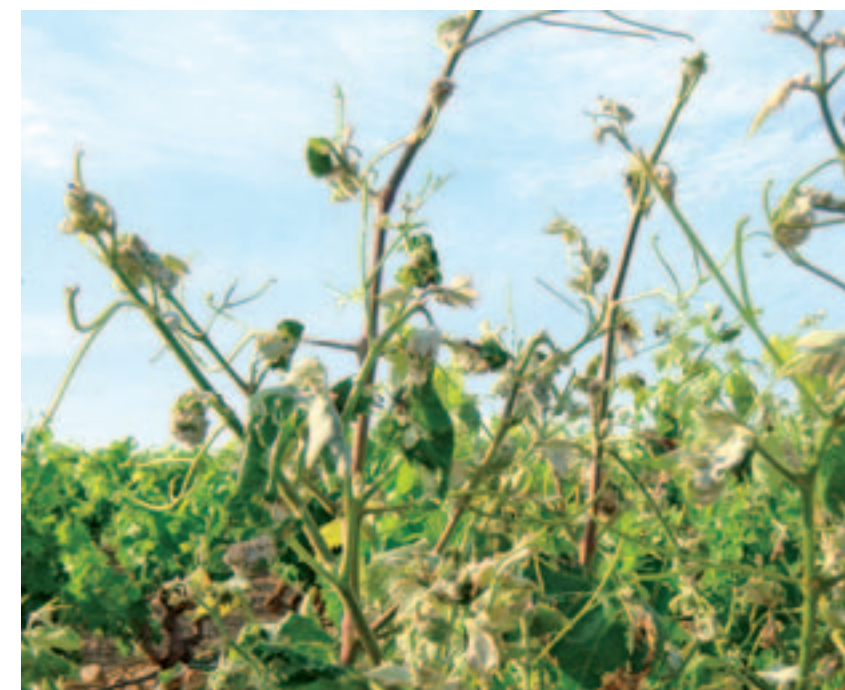
Fuerte ataque en hojas. / Guillermo Martínez Ruiz-Clavijo