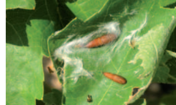
Crisálidas. / José Luis Ramos Sáez de Ojer

La puesta la realizan en el haz de las hojas en ooplacas, pequeñas platas con apariencia de gotas de cera, compuesta cada una de ellas por un conjunto de 20 a 100 huevos. Esta