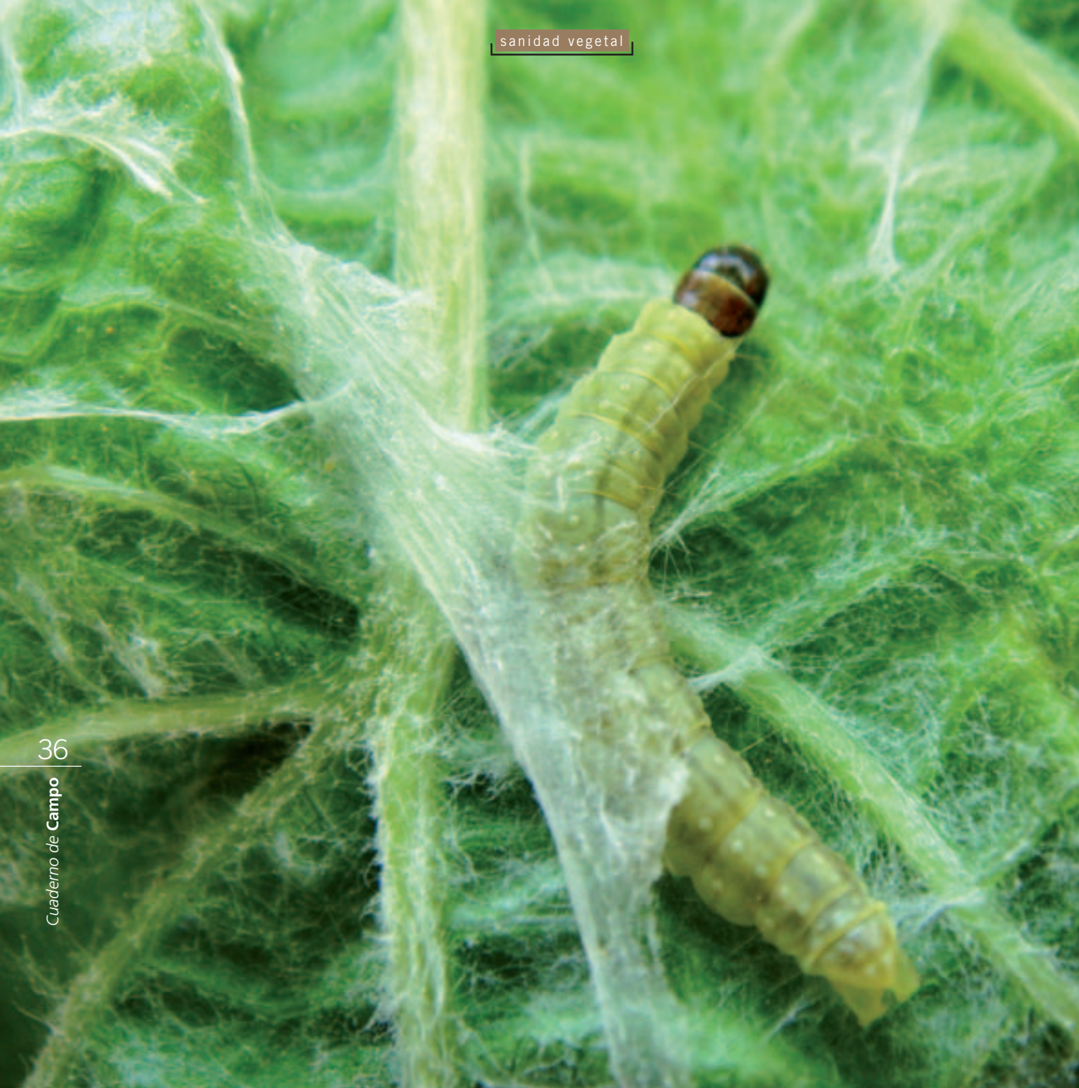
Larva con su característica cabeza negra.