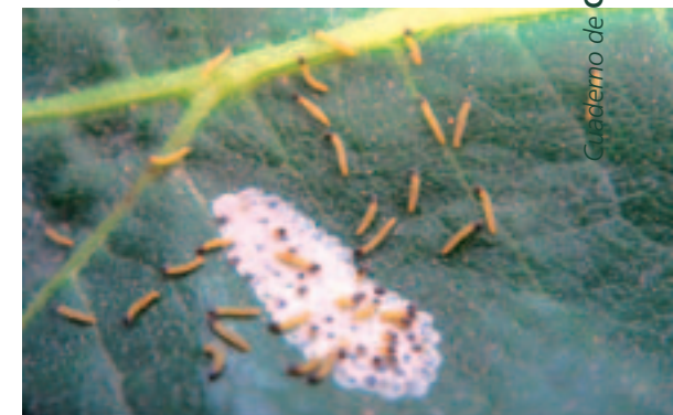
Salida de larvas de ooplaca.

puesta la hacen principalmente en las hojas viejas basales cercanas al tronco de la cepa, para facilitar a las larvas emergentes la migración a los refugios invernales. Desde su puesta hasta la eclosión cada ooplaca toma diversos colores: verde esmeralda (recién puesta), amarillento, gris con puntos negros (próximo a eclosionar) y blanco (una vez eclosionado).