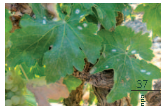
Puesta en ooplacas en hojas basales. / Guillermo Martínez Ruiz-Clavijo