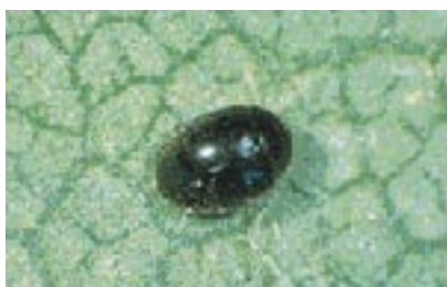
Foto Superior: Adulto de Stethorus punctillum . Tamaño: 1,5 mm.

Adultos y larvas son predadores enérgicos. En fruticultura, sus poblaciones, importantes en verano, son capaces de limitar eficazmente las infestaciones de ácaros.