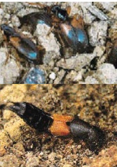
Foto Superior: Aduto del carábido Agonum dorsale . Tamaño: 10 mm./ "Les Auxiliaires".

Un suelo rico en materia orgánica y sin exceso de agroquímicos favorecerá las poblaciones de estas especies.