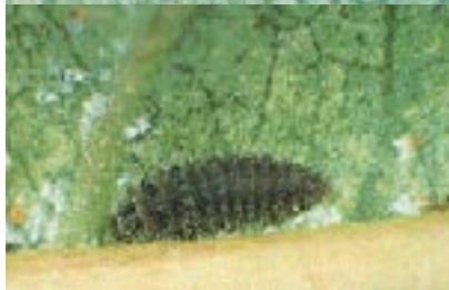
Foto Inferior: Larva de S. punctillum . Tamaño en el último estadio: 2,5 mm.