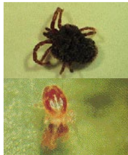
Foto de arriba: Aduto de Allothrombium sp. / Elisa Baroja Hernández.

De la familia Trombídidos destaca Allothrombium sp. , cuyas ninfas y adultos son depredadores de pulgones, tetránquidos y huevos de lepidópteros. En ocasiones pueden devorar larvas de Psila. Las larvas no depredan a esas plagas, sino que las parasitan externamente.