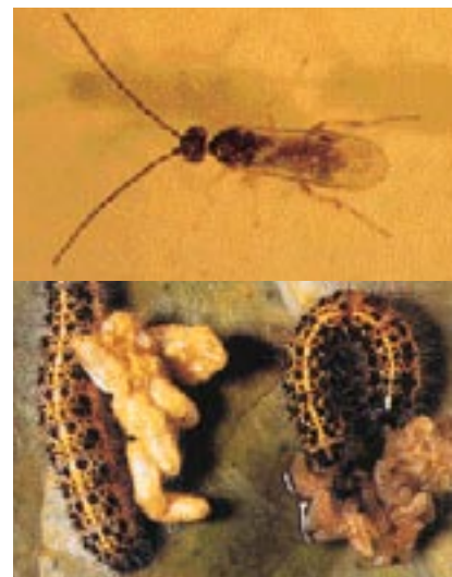
Foto Superior: Aduto de Apanteles glomeratus . / "Peral: Control Integrado de Plagas y Enfermedades"

Además de este endoparasitismo o parasitismo interno, otras especies son ectoparásitas o parásitas externas, cuando los huevos se depositan sobre el cuerpo del huésped o cerca de él tras anestesiarlo.