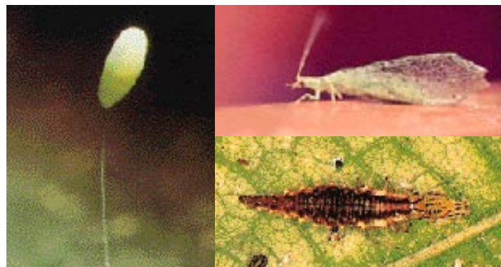
Foto superior derecha: Chrysoperla carnea suele volar en horas crepusculares. Tamaño medio: 20 mm.

Una larva es capaz de depredar a lo largo de su desarrollo (15-20 días) hasta 500 pulgones.