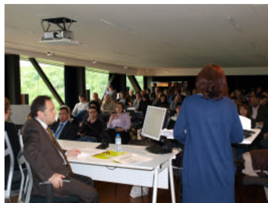
Realización de una Jornada anual de difusión y presentación a Gestores, Entidades Colaboradoras y público interesado, de la nueva gestión de la formación de oferta en La Rioja