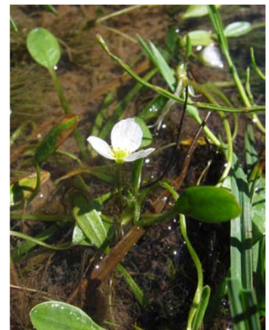
Baldellia alpestris . J.I. Esquisabel