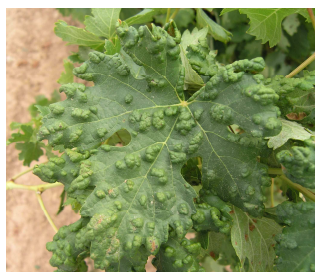
Síntomas de erinosis.