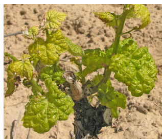
Síntomas de acariosis.

Se observa en numerosos viñedos la presencia de estos ácaros eriófidis, principalmente de erinosis, por lo que se recomienda vigilarlos y realizar tratamientos en caso necesario con un acaricida autorizado.