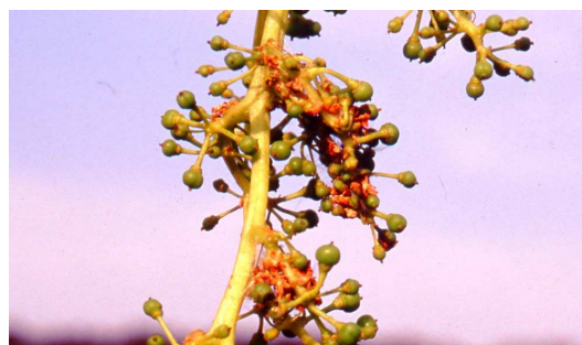
Daños de primera generación de polilla del racimo.