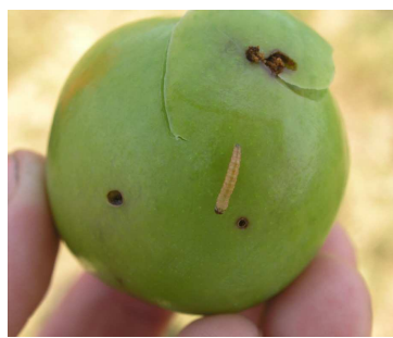
Daños y larva de Cydia funebrana .

Los daños pueden confundirse con anarsia y solamente en caso de encontrarse la larva es posible diferenciar a las plagas.