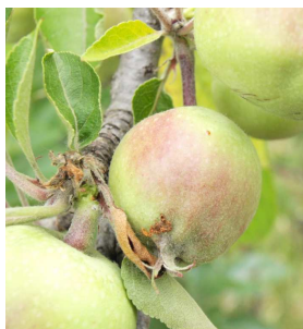
Daños en manzana.