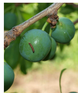
Larva de anarsia.