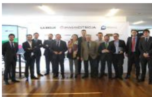
IMAGEN DE LA INAUGURACIÓN.

En este sentido, Javier Erro señaló que la Oficina de Asuntos Económicos propuso como reto para la economía riojana mejorar la productividad de las empresas, incorporando elementos de alto valor añadido como son las aplicaciones. También destacó la apuesta del Gobierno de La Rioja por promocionar las KETS o tecnologías clave habilitadoras por considerarlas estratégicas para alcanzar una economía sostenible y basada en el conocimiento.