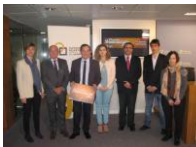
IMAGEN DE LA RUEDA DE PRENSA.

El Premio a la Innovación en la categoría Proyecto tiene por objeto distinguir iniciativas que generen un cambio positivo en la sociedad desarrollados por empresas, asociaciones benéficas u organizaciones sin ánimo de lucro. El jurado ha otorgado esta distinción al Proyecto de la Universidad de La Rioja Motostudent.