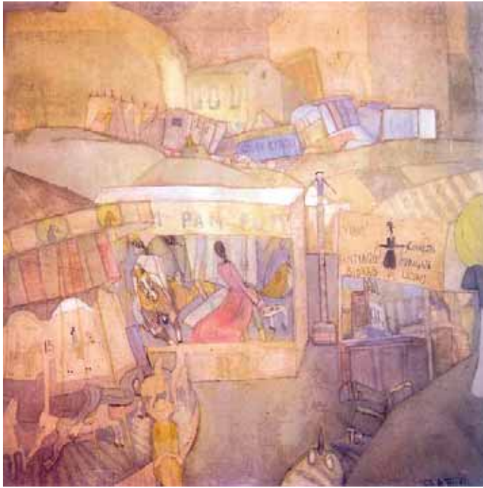
El Pim Pam Pum (1924).