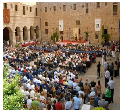
Inauguración de la sede y acto del Día de La Rioja en que se hizo entrega de la Medalla de Oro a la entidad.

el Club de Marketing de La Rioja. Así, la entidad ha recorrido en poco tiempo unos espacios de reflexión que la han ido capacitando para responder a retos importantes y a fijar metas de futuro, como contempla el consensuado I Plan Estratégico de ASPACE-Rioja.