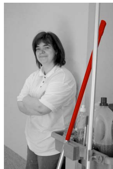
Trabajadora de ASPACE-RIOJA

ASPACE-Rioja surge el 21 de abril de 1982, al amparo del artículo 22 de la Constitución Española, siendo su ámbito de actuación la Comunidad Autónoma de La Rioja. El motor que promueve el nacimiento de esta asociación es la existencia de carencias en el tratamiento, atención y educación del colectivo de personas con parálisis cerebral y deficiencias afines.