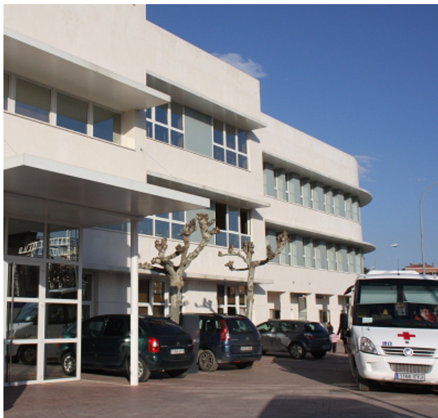
Instalaciones de ASPACE - RIOJA