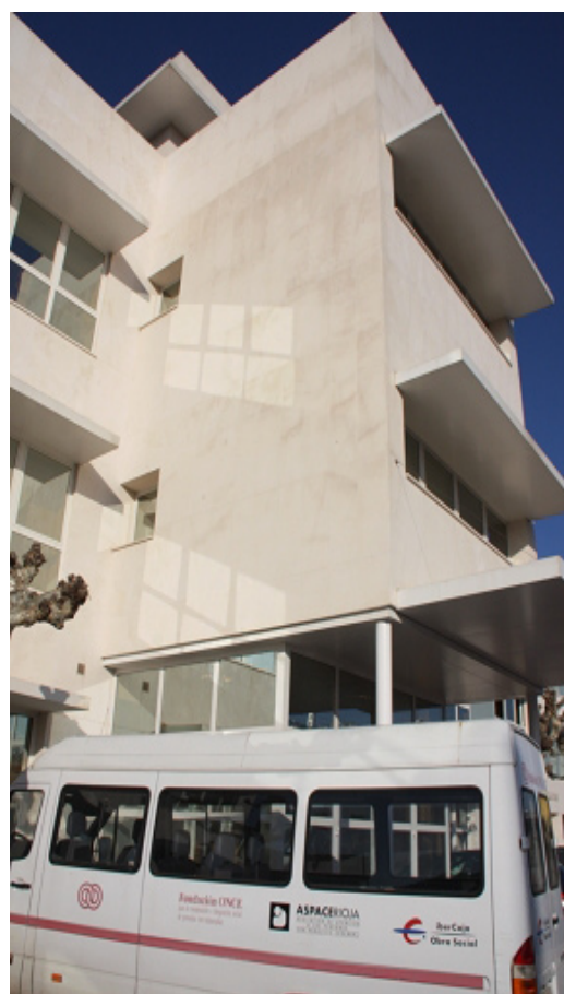
Instalaciones de ASPACE-RIOJA

Y de nuevo, otra fecha para el recuerdo: el 7 de enero de 2009, en que se abrieron las puertas del nuevo Centro de Atención Integral, que vuelve a reunir a todos los servicios y supone un gran paso para asegurar la calidad de vida de nuestro colectivo. Mayor espacio, nuevas dependencias y un equipamiento moderno mejoran nuestras condiciones en un año difícil para ASPACE-Rioja, que comienza a sufrir también las consecuencias de la crisis actual y la aparición de dificultades económicas y debates internos.