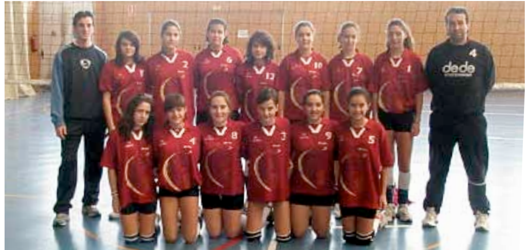
■ Equipo riojano infantil de voleibol, ganador del premio Juego Limpio